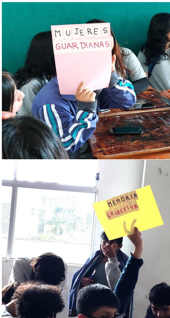
Figura 7. Estudiantes de 10mo EGB-ECA. Resultados del juego de palabras.

En algunos casos hubo dificultad para construir las palabras, pero con pistas como la letra inicial o una idea relacionada al significado, todos pudieron resolverlo. Conceptos como “patrimonio intangible” o “legado ancestral” presentaron dificultad en su comprensión, pero al armar conjuntamente la frase final fue posible explicar conceptos y dialogar sobre la importancia de las palabras en cuestión.