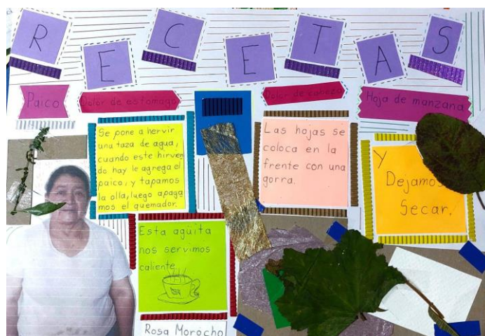
Figura 13. Muestra de uno de los trabajos finalizados.