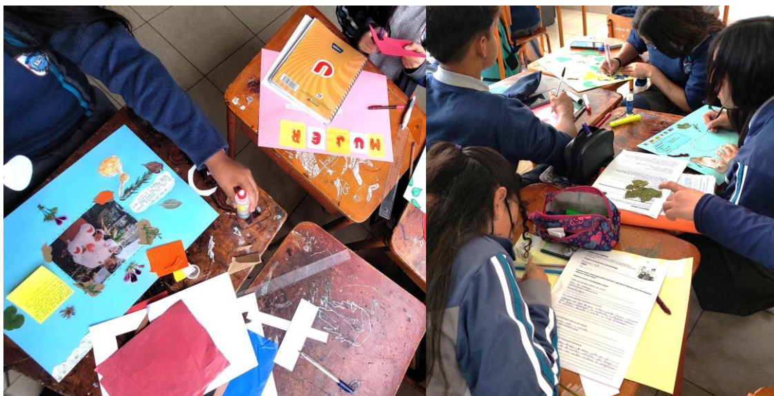
Figura 10. Estudiantes de 10mo EGB-ECA. Taller de creación.

La actividad tuvo una duración de aproximadamente dos horas clase, destinando los últimos 15 minutos para el cierre. Para esto, debido al corto tiempo, se colocaron los trabajos encima de cada mesa y se solicitó a los estudiantes que recorrieran el aula por unos minutos para apreciarlos.