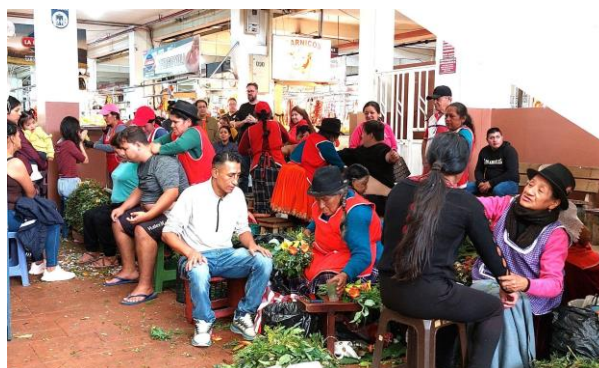
Figura 1. Área de mujeres sanadoras en el Mercado 10 de agosto en la ciudad de Cuenca.

En el contexto de la ciudad de Cuenca, esta realidad es palpable incluso en el entorno urbano. Drexler y Contento (2017), en su análisis desde una perspectiva intercultural de las prácticas para el tratamiento de enfermedades por parte de sanadoras, mencionan que "Todos los martes y viernes se pueden ver largas filas de madres con sus hijos buscando los servicios de las sanadoras en los mercados urbanos de Cuenca" (p. 296).