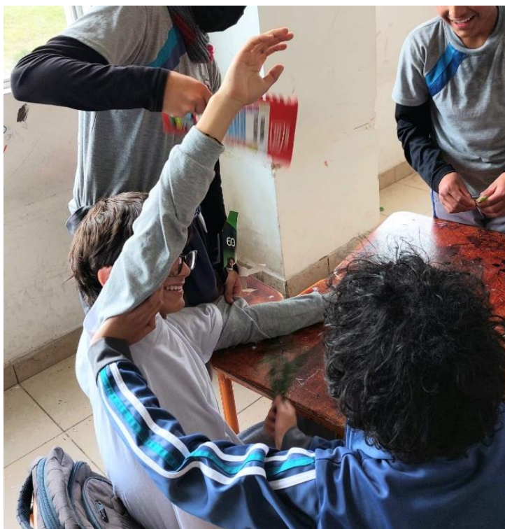
Figura 5. Estudiantes de 10mo EGB-ECA. Grupo simulando limpiezas con ramas de ruda.

Los estudiantes nombraron las plantas que reconocían, algunos disfrutaban el olor, otros lo rechazaban, mencionaban recordar a sus abuelas o haber visto aquellas plantas en sus huertos, cocinas y la manera de usar especies como la ruda; hubo quienes comenzaron a golpear con ramas el cuerpo de sus compañeros simulando limpiezas.