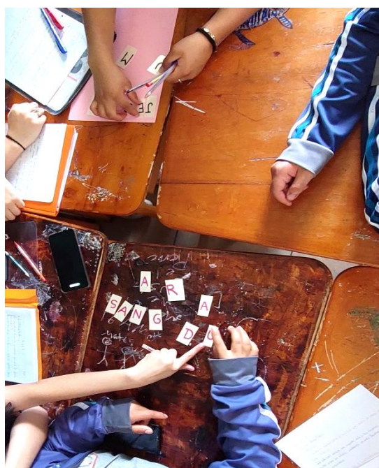
Figura 6. Estudiantes de 10mo EGB-ECA. Iniciando el juego de palabras.

El juego de ordenar las letras descifrando cada palabra asignada y el hecho de competir con los otros grupos por quienes lo hacían primero, creó una interacción continua que mantuvo la concentración de la mayoría.