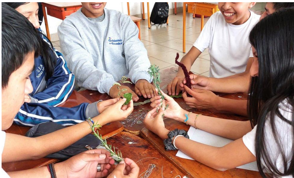
Figura 4. Estudiantes de 10mo EGB-ECA. Organización en grupos y entrega de plantas medicinales.

Los estudiantes nombraron las plantas que reconocían, algunos disfrutaban el olor, otros lo rechazaban, mencionaban recordar a sus abuelas o haber visto aquellas plantas en sus huertos, cocinas y la manera de usar especies como la ruda; hubo quienes comenzaron a golpear con ramas el cuerpo de sus compañeros simulando limpiezas.