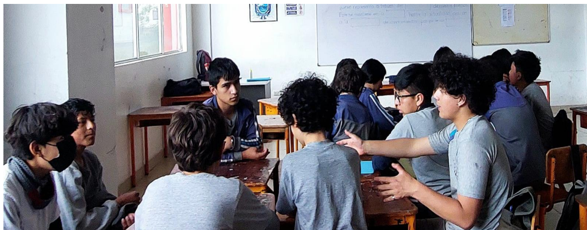
Figura 11. Estudiantes de 10mo EGB-ECA. Participación de estudiante contando su experiencia.

En esta fase de consolidación , se eligió a ciertos participantes para que relaten su experiencia al realizar la entrevista y el collage y se descartó una participación oral individual, por lo que la evaluación se realizó en base a los trabajos concluidos.