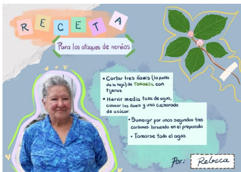
Figura 9. Modelo de collage propuesto a los estudiantes realizado en base a entrevista.

La fase de construcción empezó con la presentación de imágenes con referencias de diversos tipos de collage, para que cada estudiante identifique la técnica artística y pueda inspirarse. Sin embargo, al ver la dificultad para iniciar con sus creaciones, se presentó un modelo que reunía los elementos básicos que debía tener cada collage: una fotografía de la mujer entrevistada, el nombre de la enfermedad o mal a tratar, la preparación y el nombre de la mujer que compartió el conocimiento.