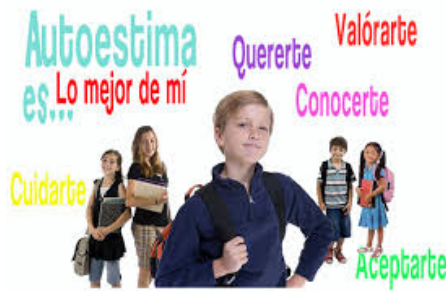
Ilustración 6

Desde el momento del nacimiento el ser humano inicia su viaje hacia el conocimiento del mundo. Primeramente, a través de sus sentidos, recibe información valiosa del entorno que procesa en su mente para después convertirse en ideas y