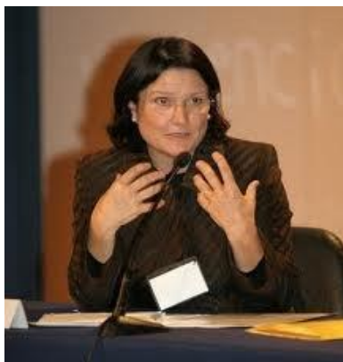
Ilustración 4 Ortega (2008) entre otros.

Para Ortega (ctd en Valadez, 2008), existen diversos tipos de acoso o maltrato, siendo los más frecuentes: