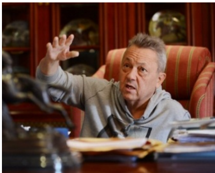
Ilustración 2 Sullivan (2003)

Como menciona Cabezas, el Bullying puede ser ejercido por un niño, por una niña o por un grupo de niños o de niñas contra un niño o niña que es tomado como eje de acoso, se presupone que el niño o niña es victimizado por poseer alguna característica diferente a nivel físico, social, cultural o académico. Otra forma de acoso se da entre maestros y estudiantes. El acoso escolar por parte de profesores se suele dar a través de la amenaza y por parte del alumno se da en forma de burlas y rechazo. Los espacios escolares al ser escenarios caracterizados por la competitividad se convierten en lugares propicios para generar el acoso escolar o bullying.