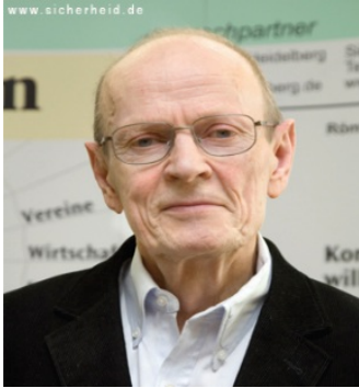
Ilustración 1 Olweus (2006:25)