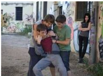
Ilustración 3 Olweus (2006)

Son actores que intervienen de manera directa en el acoso escolar. Para Olweus (2006), existen tres actores principales del acoso escolar (que forman el denominado triángulo de bullying): el agresor, la víctima y el observador.