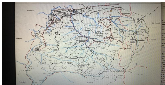
Ilustración 1. Mapa de la Parroquia Turi.

Turi fue reconocida como parroquia el 5 de febrero del año de 1853. Turi está ubicada en la región interandina del país, ocupando la parte norte de la provincia del Azuay y la parte central de lo que es el Cantón Cuenca. La parroquia Turi limita al sur con la Parroquia Tarqui, al este con la Parroquia El Valle y al oeste con la Parroquia Baños. Tiene una extensión de 2427,68 hectáreas (GAD Parroquial de Turi, 2015).