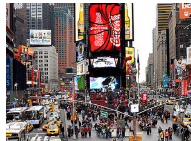
FIG. 015: Times Square antes de la regeneración urbana.

"Si las personas participan en el diseño del espacio, este responderá mejor a la forma en que desean habitarlo. Un espacio que acoja requerimientos de personas de diferentes géneros y edades tendrá un uso diverso y heterogéneo. Si los vecinos se han involucrado en su construcción, le tendrán cariño, por lo que lo cuidarán mejor y será preciso invertir menos en su mantenimiento. Una comunidad involucrada con su espacio público, que lo ha diseñado, construido y lo mantiene en forma