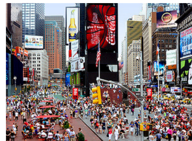
FIG. 016: Times Square después de la regeneración urbana.