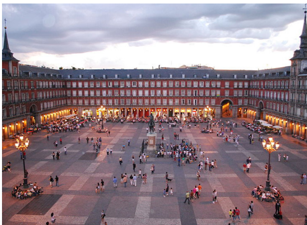
FIG. 011: Plaza mayor de Madrid-Ejemplo Plaza Cuadrangular.