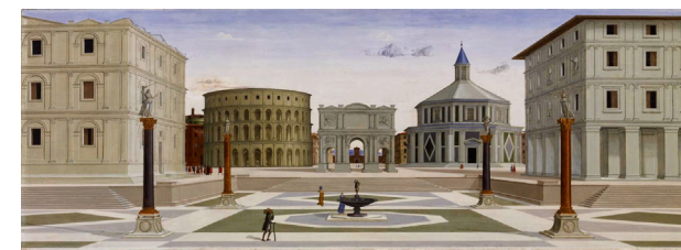
FIG. 013: Ejemplo de plaza Renacentista.

Los nodos radiales son espacios regulares. Las plazas y las vías que a ellos confluyen, constituyen una típica forma de organización francesa. La organización polar en “estrella radiante” determina un solo destino, al cual es posible acceder por vías radiales. Desde un centro principal se puede acceder a otros.”