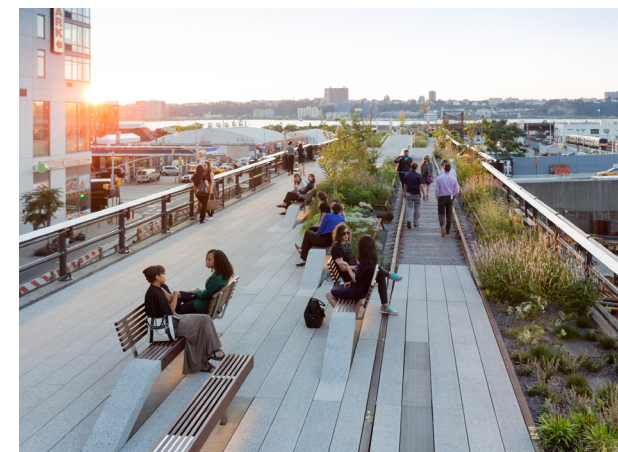
FIG. 006: Parque lineal-Espacio público en la actualidad.