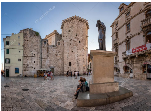
FIG. 012: Plaza Brace Radic, Croacia-Ejemplo de plaza Medieval.