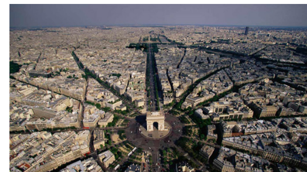
FIG. 014: Plaza de la Estrella, París-Ejemplo de nodos radiales.