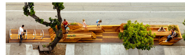
FIG. 009: Mobiliario Urbano-Diseño Simple.

"Se entiende como mobiliario urbano a todo tipo de muebles que integran a una ciudad; son de uso público y de materiales durables que resisten los cambios de temperatura y el desgaste del exterior." («Componentes-del-