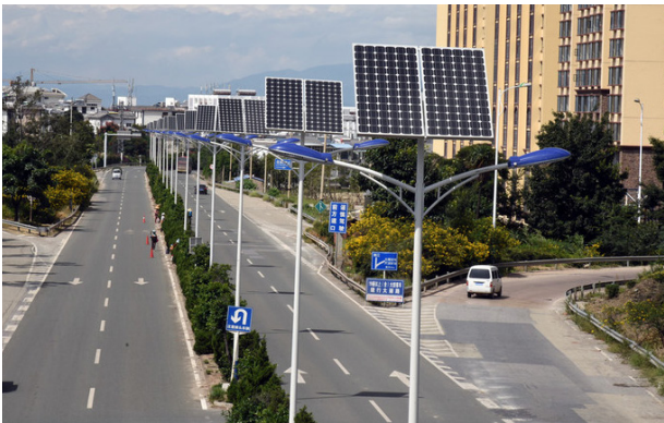
FIG. 004: Energía Renovable-Urbanismo Sustentable