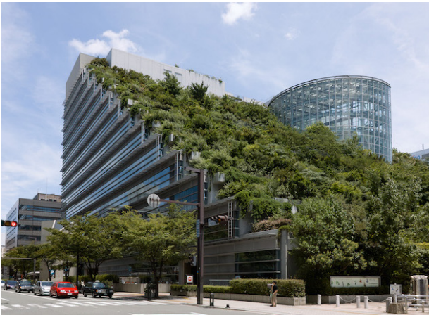
FIG. 003: Edificio Verde-Urbanismo Sustentable