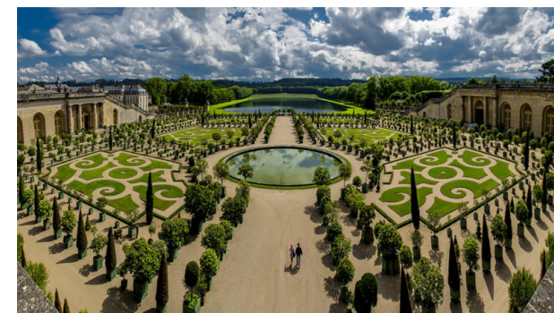
FIG. 002: Jardines de Versalles-Arquitectura del Paisaje.