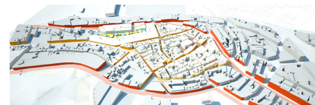
FIG. 001: Diseño urbano.

“La arquitectura del paisaje es la disciplina que se encarga de resolver la habitabilidad del espacio abierto, ya sea en lo próximo al hombre o en la organización de una región, buscando equilibrar los sistemas naturales