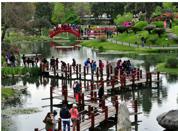
FIG. 007: Circulación - Actividades en los espacios públicos