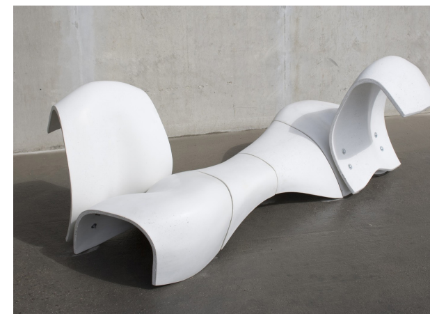
FIG. 010: Mobiliario Urbano-Diseño Complejo.