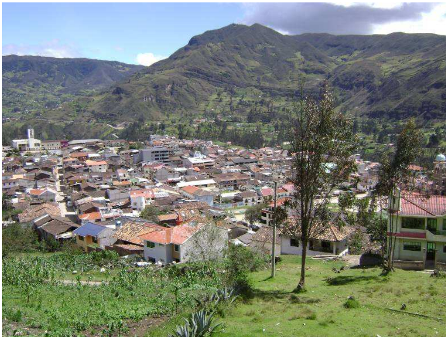
Figura 1. Vista Panorámica del Cantón Sigsig. Nótese a la izquierda la iglesia de San Sebastián y a la derecha la Iglesia de María Auxiliadora.

Fue declarado Patrimonio Cultural del Ecuador en agosto del año 2002 y está constituido por 182 inmuebles que mantienen las características constructivas espaciales y expresivas propias de la arquitectura popular tradicional.