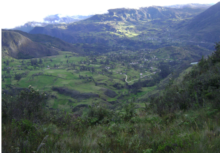
Figura 7. Parte de la visión desde la cima del Cerro Mesaloma.

La cima del Cerro Mesaloma es una amplia planicie, llena de vegetación, desde donde se observa el pueblo de Principal, el cerro Fasayñan, el nacimiento de las vertientes de agua y el sector conocido como Pueblo Viejo (Figura 7).