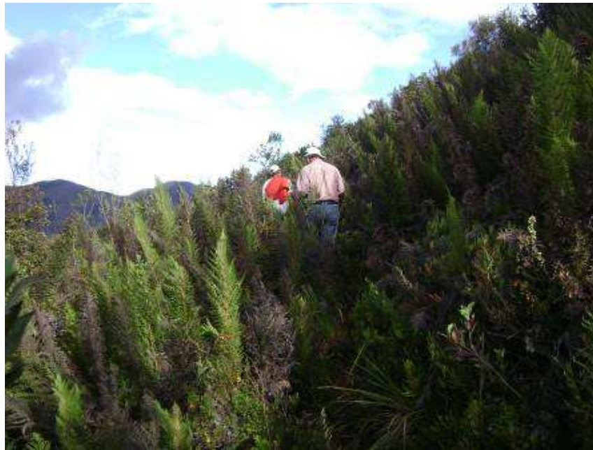
Figura 6. Trayecto hacia el Cerro Mesaloma.

La cima del Cerro Mesaloma es una amplia planicie, llena de vegetación, desde donde se observa el pueblo de Principal, el cerro Fasayñan, el nacimiento de las vertientes de agua y el sector conocido como Pueblo Viejo (Figura 7).