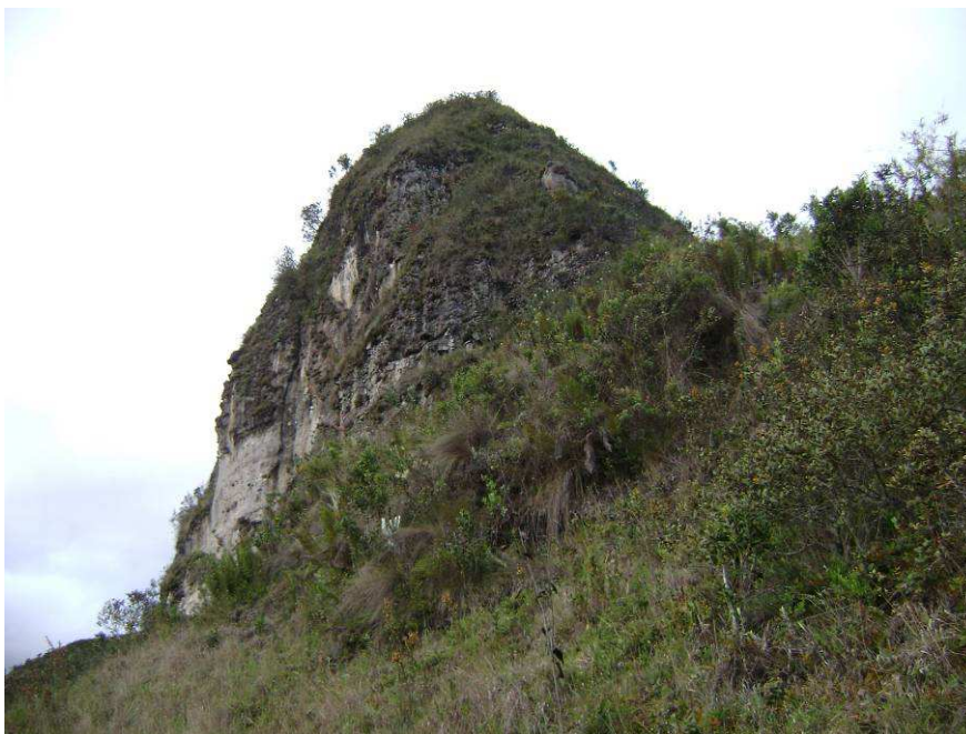
Figura 8. Perfil del Cerro Pileo.

De regreso a la mini granja, al bajar se pasa por el cerro Pileo, desde donde también se puede observar la diversidad del paisaje urbano y rural. (Figura 8)