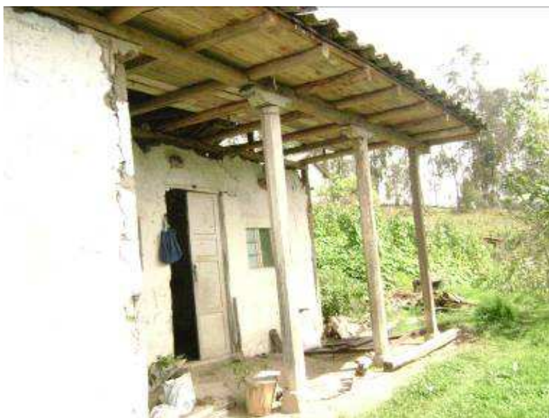
Figura 9. Estructura actual de la Casa de Campo.

Posteriormente se realizará un recorrido por los diferentes sembríos, indicando las propiedades nutritivas de cada cultivo y con una demostración de las actividades propias del campo, como siembra, abonadura, deshierbe, cosecha, etc., en las cuales el turista puede colaborar el agricultor.