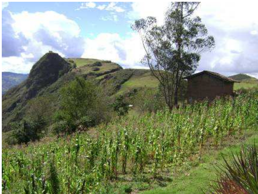
Figura 3. Al fondo la cresta sobresaliente del Cerro Vayanzhún.

Los cerros circundantes a la comunidad de Puchún y a la mini-granja, son poco conocidos a nivel provincial, pero ofrecen diferentes alternativas de pasatiempos como caminatas, senderismo, camping, excursiones de alta montaña, observación de paisaje urbano y rural del cantón Sígsig, fotografía, etc.