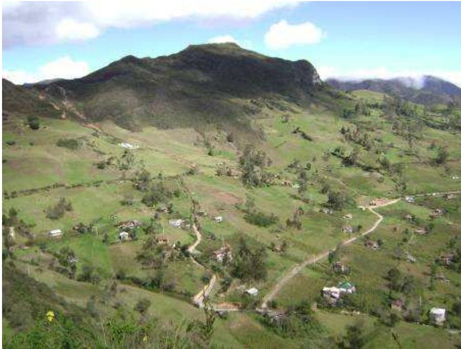
Figura 5. Parte del paisaje observado desde el cerro Vayanzhún.

Después del Cerro Vayanzhún se puede continuar el recorrido, hasta el cerro Mesaloma. Para llegar a este lugar la caminata es exigente, apta para quienes estén en buen estado físico, ya que los tramos están formados por empinadas cuestas, que se puede tardar hasta una hora en llegar a la cima.