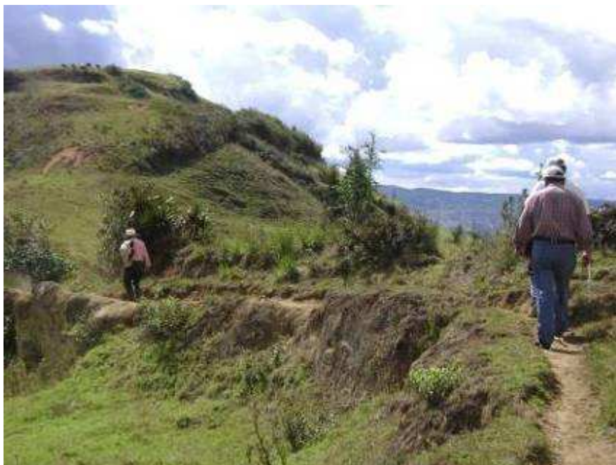
Figura 4. Caminata en dirección al Cerro Vayanzhún guiado por un lugareño.

En la cima de este cerro se encuentra una pequeña casa que alberga en su interior una cruz de madera y en la proximidad existe una amplia planicie, ideal para actividades de camping. Desde este lugar la vista es espectacular (Figura 5), ya que por un lado se puede divisar parte de Gualaceo, San Bartolomé, el pueblo del Sígsig y por otro el cerro Fasayñán seguido por una gran cantidad de predios agrícolas y ganaderos.