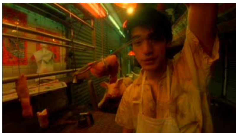
Chunking Express (1994) de Wong Kar Wai.