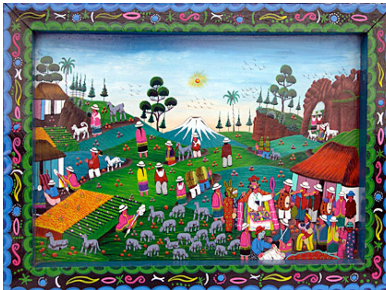
El festival de la lana de Julio Toaquiza.

Uno de los principales referentes es el maestro Julio Toaquiza, con su amplia paleta de colores y composición acumulativa, muy similar al entorno de nuestros personajes.