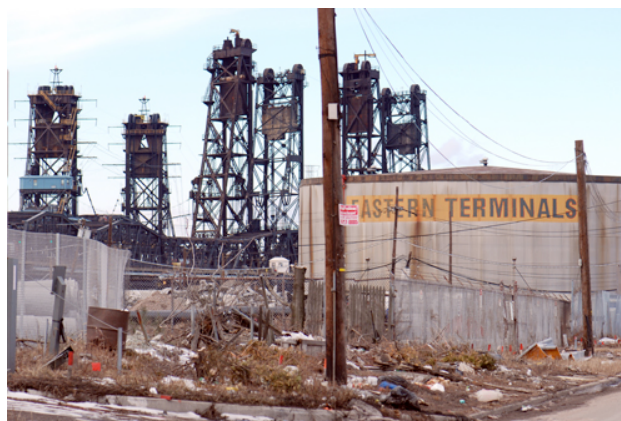
Jersey City, New Jersey.

Para aquellos que no pudieron lidiar con la estimulante pero absorbente ciudad de Nueva York, se encuentra New Jersey. Un escenario radicalmente opuesto, industrial y predominantemente gris.