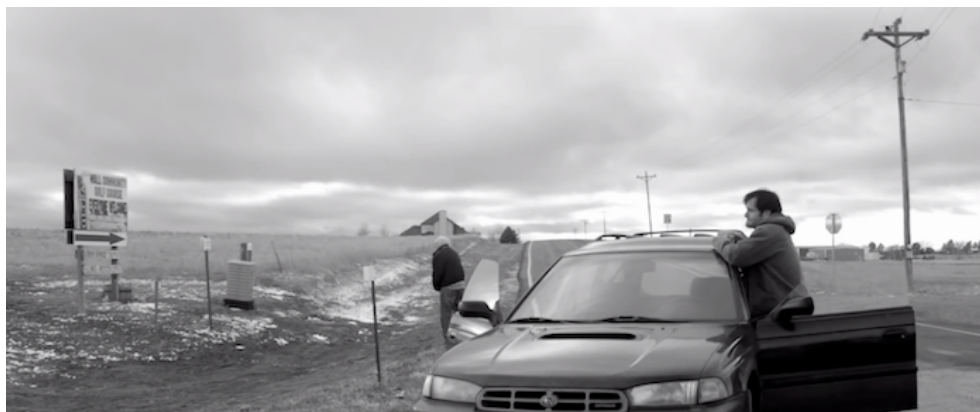
Nebraska (2013) de Alexander Payne.

La propuesta para este espacio parte de trabajar con imágenes desaturadas, sin llegar al blanco y negro; además, planos panorámicos para acentuar lo desolado del espacio, y movimientos lentos de cámara que apoyan la sensación de tiempo suspendido, propio de la ciudad, muy diferente a la aceleración de Nueva York.