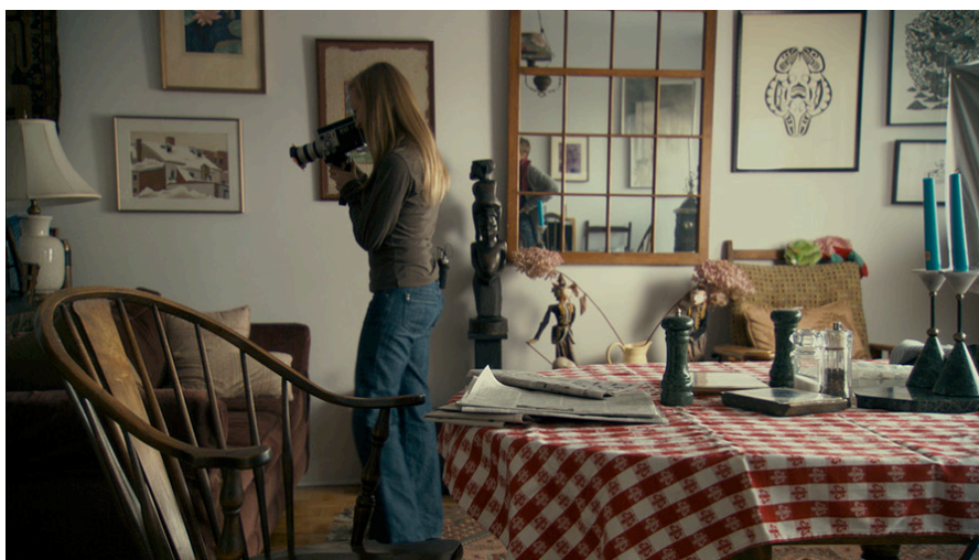
The stories we tell (2012) de Sarah Polley.

Dentro de su hogar trabajaremos con una temperatura de color más cálida para crear contraste entre el entorno hostil y sombrío que los rodea y el espacio acogedor en el que habitan. Se trabajará con planos abiertos y medios, con la finalidad de establecer una relación simbiótica entre personajes y entorno.