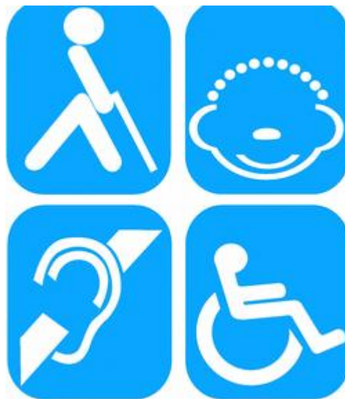
Ilustración 3 Discapacitados

En la parte sociológica es la que determina las conexiones de las relaciones sociales, hace se vean como anormales, merecedores de etiquetas como: “tullidos”, “tarados”, “retrasados”. En alguna ocasión un médico, en una intervención se manifestó ante las discapacidades o las mal formaciones congénitas como “seres monstruosos”. ¿Que nos lleva a mirar la deformidad de unos y no lo que pueden representar para otros? En algunas circunstancias todos muestran incapacidad, siendo dependiente y encontrando impedimentos para realizar una actividad. De forma que todos muestran discapacidad de alguna manera.