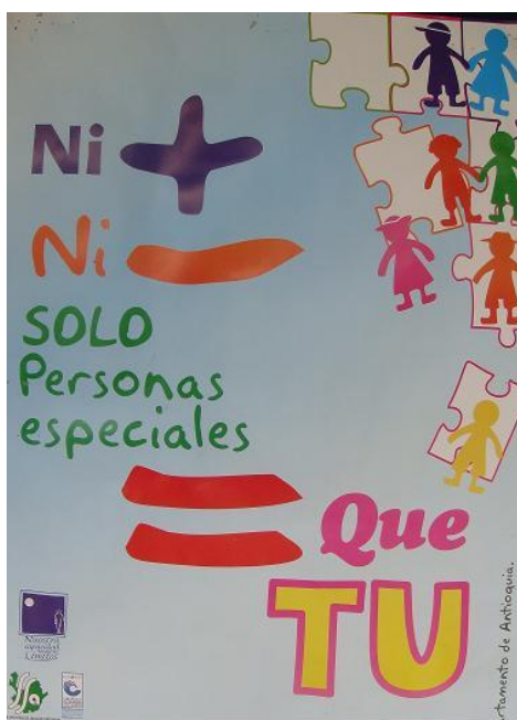
Ilustración 1 Una tarea en crecimiento: Inclusión escolar. Fuente: (Cánepa, 2011)

Ser excluido de todo lo que está a su alrededor por una discapacidad, siendo excluidos constantemente, siendo un impedimento para demostrar capacidad, evitando su desenvolvimiento en la sociedad de forma independiente.