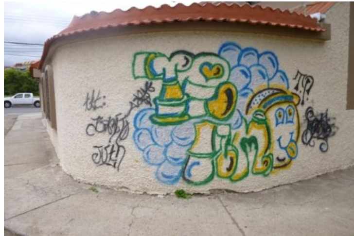
ESTILO Burbuja: Sector Ferretería Continental. Cuenca- Ecuador. (2012)

Uno de los primeros estilos que cogió auge en NY, se caracterizaba por la forma burbuja de las letras del spot, y por la rapidez en la realización de la misma.