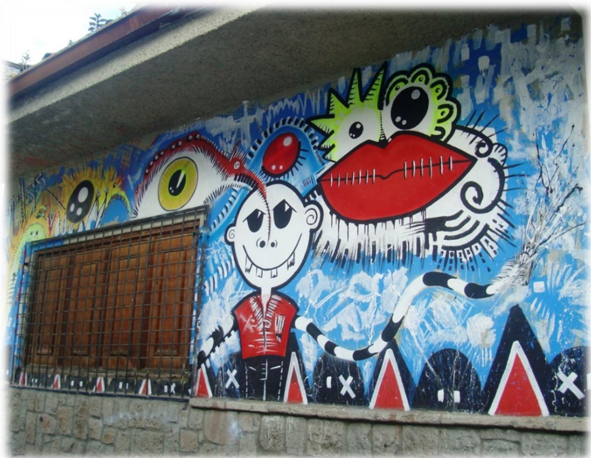
Calle Padre Aguirre y Larga. Cuenca-Ecuador (2013)