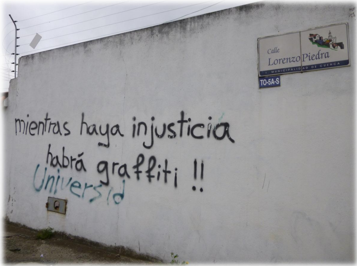
Calle Lorenzo Piedra, 2012, Cuenca - Ecuador