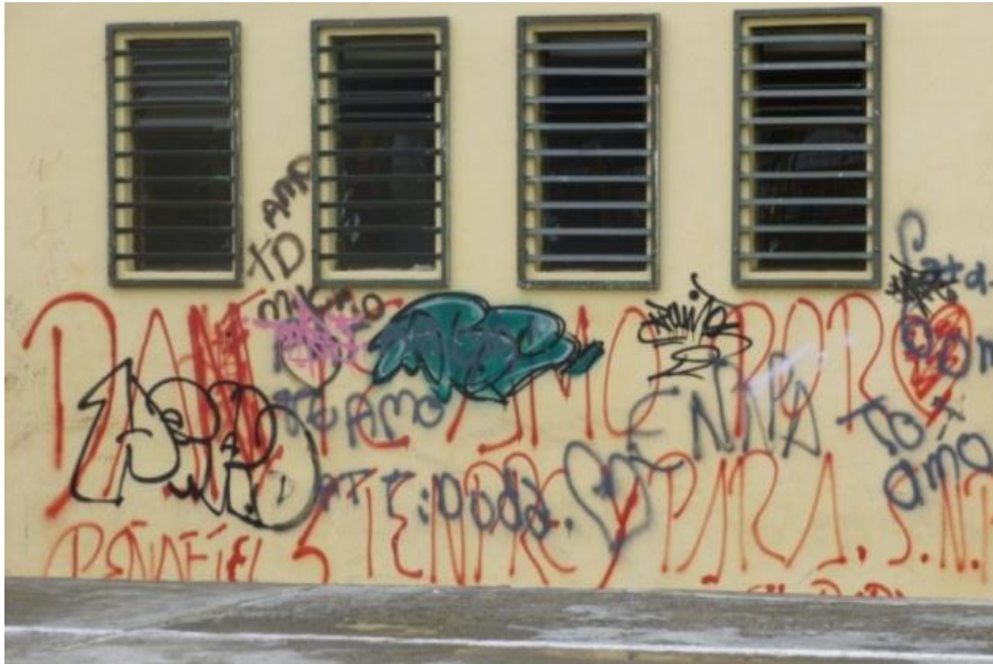
ESTILO Rudimentario: Sector de la Ciudadela Tomebamba. Cuenca- Ecuador (2012)

El grafiti rudimentario encierra en sí un nivel comunicativo único y coloquial, lleno de espontaneidad y rebeldía.