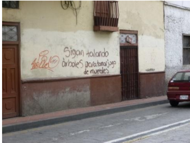
EJECUCIÓN Individual: Calle Esteves de Toral. Cuenca- Ecuador (2012)