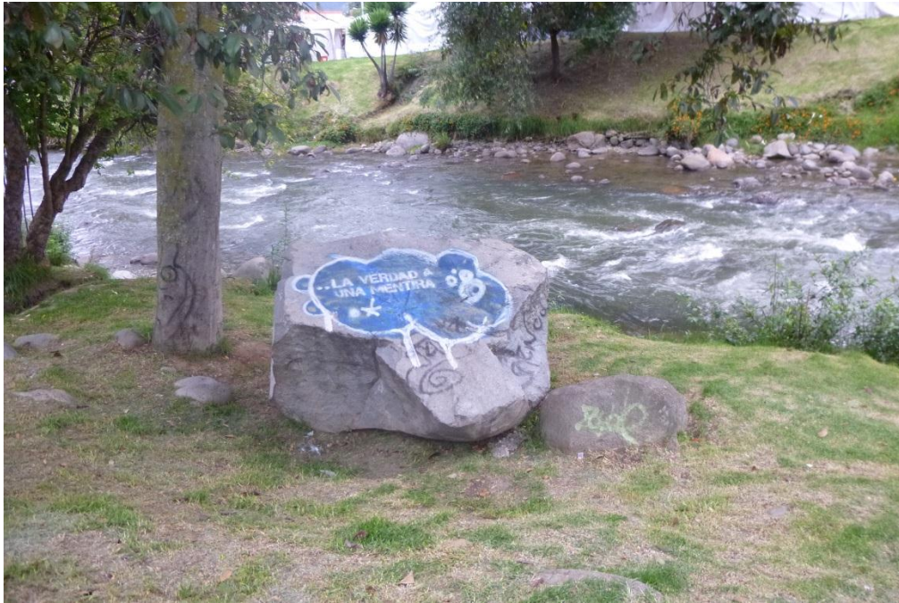
Orillas del Rio Tomebamba. Cuenca-Ecuador 2013

Según Jesús de Diego, “El contenido del grafiti guarda coherencia con lo que comunica, y a su vez está estrictamente relacionado con la estética callejera; de tal manera que, el texto puede ser una declaración de amor, como una profunda manifestación de reclamo político, de furia social. En definitiva es una manera de recobrar la palabra, una práctica popular y creativa de agrietar los discursos monolíticos del poder y las instituciones”.