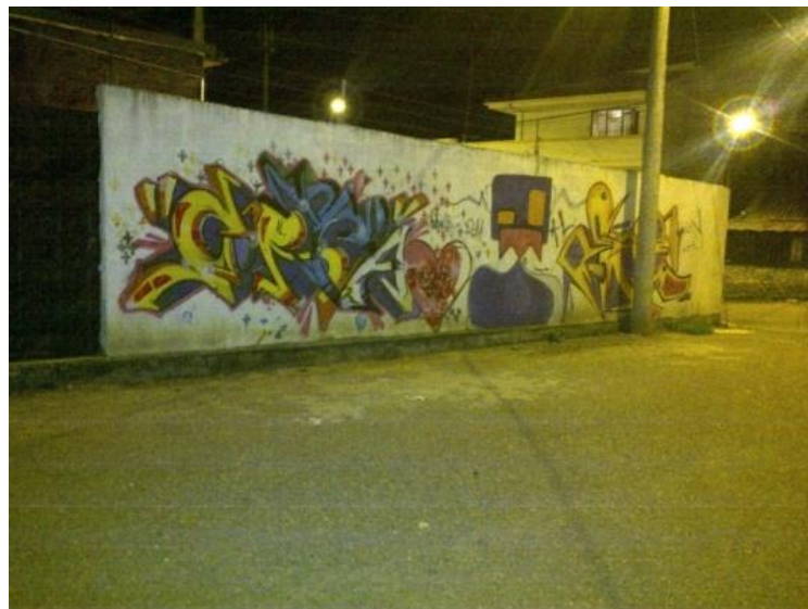
ESTILO Sobrepuesto: Calle de los V Juegos Nacionales, las Orquídeas Parroquia Hermano Miguel. Cuenca- Ecuador (2012)

Se lo denomina así por la forma como las letras se sobreponen unas de otras. Este estilo se originó por la competencia existente entre grafiteros cada vez con mejor estilo y mayor dificultad en la creación de letras.