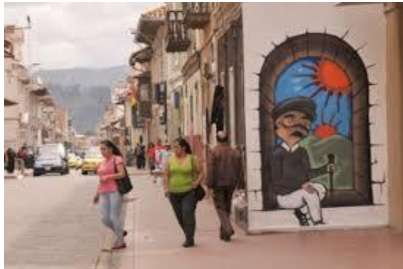
ESTILO 3D SPOT: En la calle Mariscal La Mar y Benigno Malo (2013) PROYECTO “ESPACIOS RECIDUALES” DE LA MUNICIPALIDAD DE CUENCA

Los artistas peleando por saber cuál es el mejor, evolucionan sus obras a tal punto de ponerle realismo, e implementar efectos con el spray y dar sensación de tridimensionalidad, cada obra individual se la denomina “spot”.