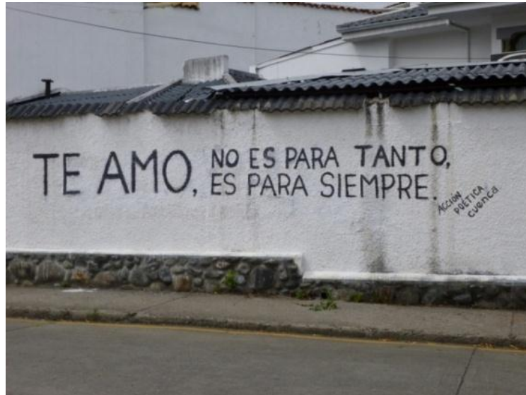
MENSAJE Romántico: Calle Miguel Cordero. Cuenca- Ecuador (2013)

Existen otros de contenido romántico que son más trabajados, el estilo y la técnica está a la elección de la persona que realiza el grafiti.