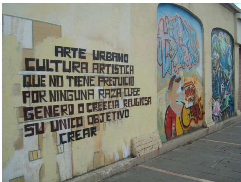
Calle Bolívar y Av. Huayna Cápac. Cuenca – Ecuador (2013)

“Se puede decir que soy autodidacta, aprendí yo mismo y he ido mejorando. Mi estilo es el Trowal y el Wall Style, empezamos pintando los alrededores del cementerio, de los colegios, salíamos en la noche, pero mi primera pintada fue en Totoracocha, un muro donde hicimos unas letras, fue un grafiti ilegal, respeto mucho lo que es ilegal y vandalismo porque ese mismo es el concepto de grafiti.