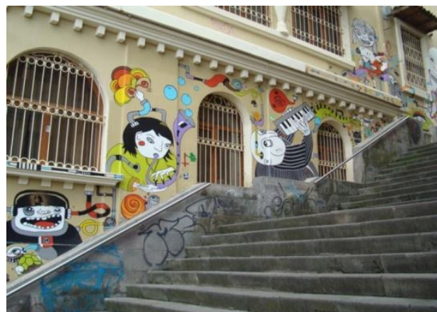
Mural: Escalinata del Hotel Crespo. Cuenca- Ecuador. (2012)

Se caracteriza porque las paredes están llenas de coloridas ilustraciones entre frases que expresan algún sentimiento. Se reúnen grupos de personas con varias cajas de aerosol, botes de pintura, brochas, rodillos, frente a muros inmensos.