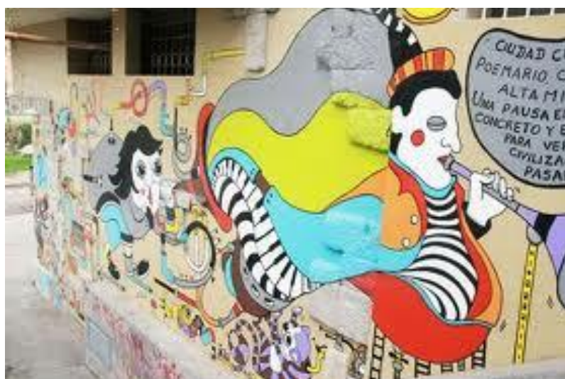
MURAL: Escalinata del Hotel Crespo. Cuenca- Ecuador. (2012)

Para el artista Marco Medina, ganador del concurso “Arte Grafiti y Mural en Espacios Residuales del Centro Histórico de Cuenca” convocado por el Municipio local en septiembre de 2013, el mural es más formal y se lo realiza en formatos grandes, usa brochas y para el trabajo fino, pinceles”. Un muro con varios “spots” se le denomina “meeting of styles”, es un mural.