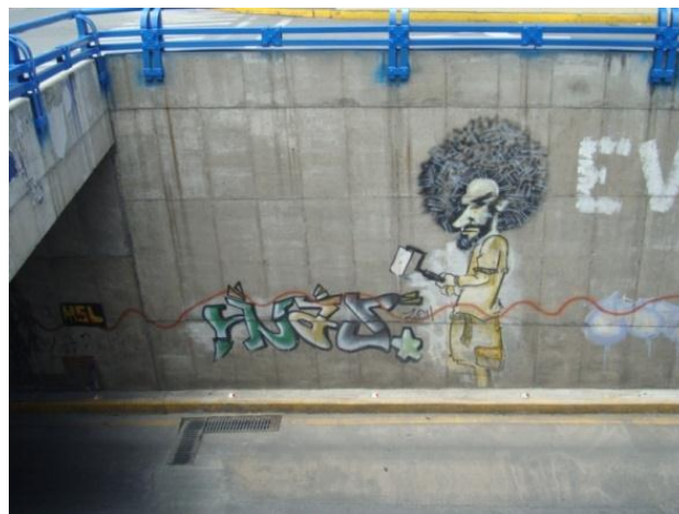
MENSAJE Autorrealización: Puente sobre el río Tomebamba, sector subida de Todosantos. Cuenca- Ecuador (2013)

En la subcultura del art writing existen muchas maneras de marcar diferencias entre “escritores” haciendo “sopts” o piezas de grafiti en lugares complicados de acceso público, estableciendo nuevos estilos de escritura, composiciones más elaboradas e ilustraciones más realistas. En el círculo de los colectivos hip hoppers las personas activas tienen respeto de los demás integrantes del grupo, en la cultura; los MC’s, Dj’s, grafiteros, breakers, poseen más “status”, más reconocimiento.