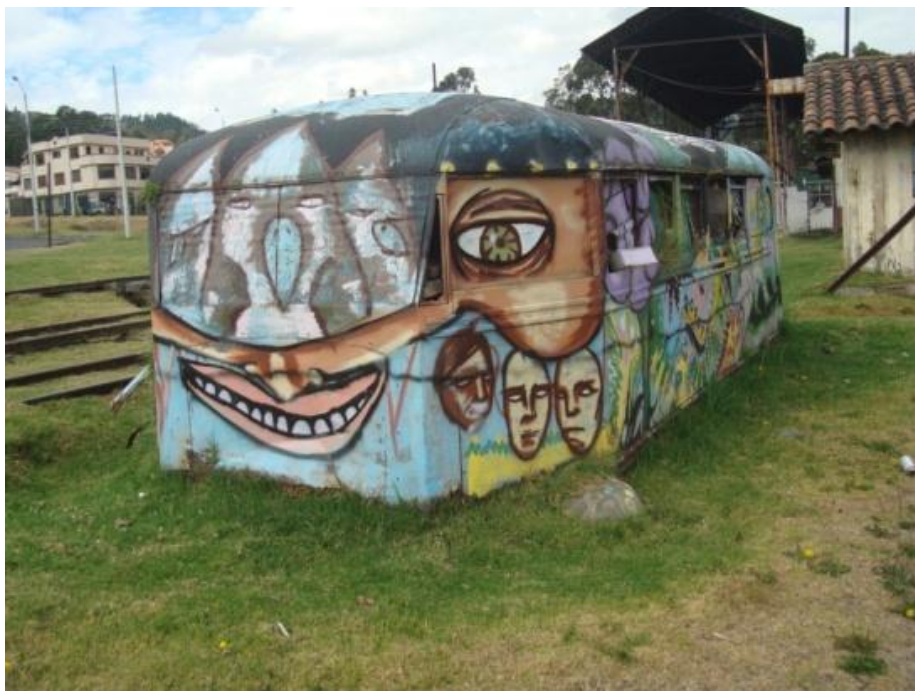
En Vehículos: Antigua estación del ferrocarril Gapal. Cuenca- Ecuador (2012)

Existe grafiti en trenes, automóviles “tuning”, buses, e incluso aviones.