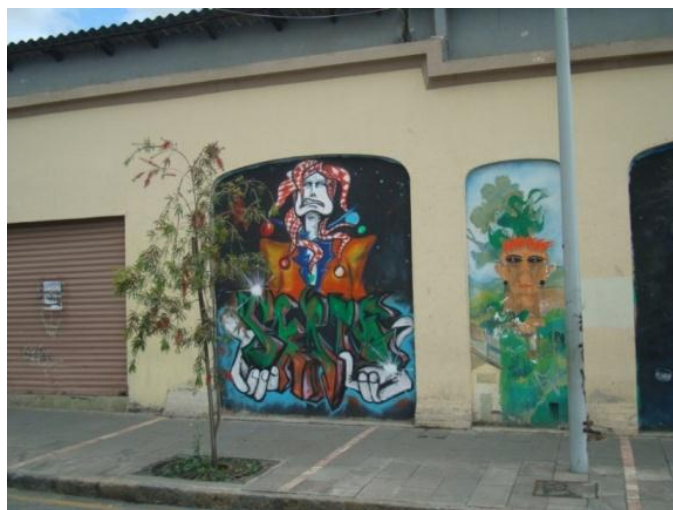
ESTILO Wild Style o Estilo Salvaje: Calle Bolívar. Cuenca- Ecuador. (2011)

La traducción literaria es estilo salvaje y se refiere al estilo más elaborado, con una gran dificultad de creación, y de entendimiento por parte de los espectadores. Se caracteriza por la mezcla de trazos que dan forma a un “spot”