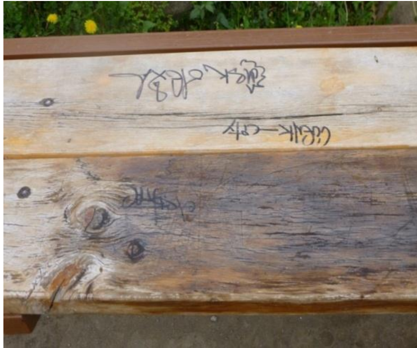
TÉCNICA Scratchin: Pupitre de una Escuela de Ricaurte. Cuenca-Ecuador (2013)