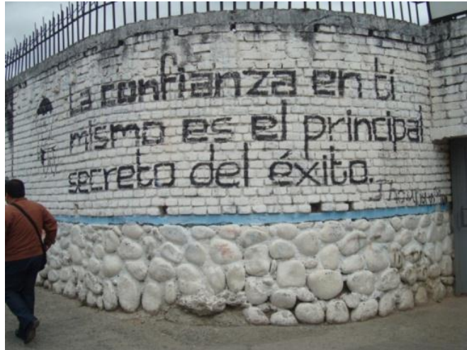
MENSAJE Social: Calle Margarita Torres. Cuenca- Ecuador (2012)