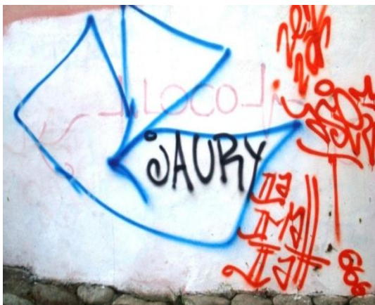
ESTILO Rudimentario: Tag realizado en la ciudadela del Bosque de Monay. Cuenca- Ecuador. (2011)