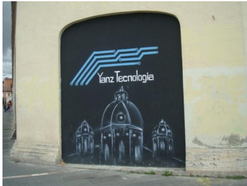
TÉCNICA Aerógrafo: Calle Bolívar. Cuenca- Ecuador. (2012)

También se lo utiliza como grafiti rótulo decoración pintura spray para diseñar, decorar y pintar cualquier tipo de superficie; habitaciones, persianas, discotecas, vehículos, decorados, stand, pintura de interiores, galerías, cocinas, fachadas, realismos , naves industriales, diseña murales artísticos y de decoración, casa, jardín, moto, coche, casco, tabla de skate o cualquier tipo de establecimiento.