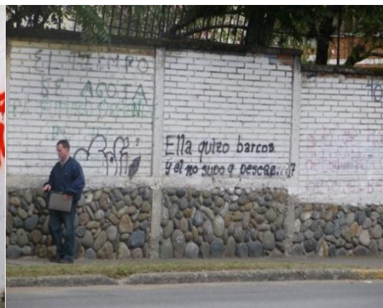
ESTILO Rudimentario: Muros del Colegio Antonio Ávila. Cuenca- Ecuador. (2012)