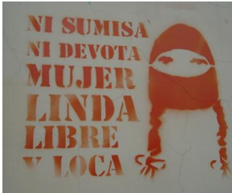
TÉCNICA Stencil: Grafiti en la Av. 24 de Mayo. Cuenca-Ecuador

Del stencil se conoce poco en nuestro país, y por su naturaleza existen pocos referentes. En Cuenca, está tomando fuerza y creciendo en proporciones geométricas por el hecho de realizarse rápido en lugares muy visibles y por ende peligrosos para aquel que lo realiza en propiedad privada.