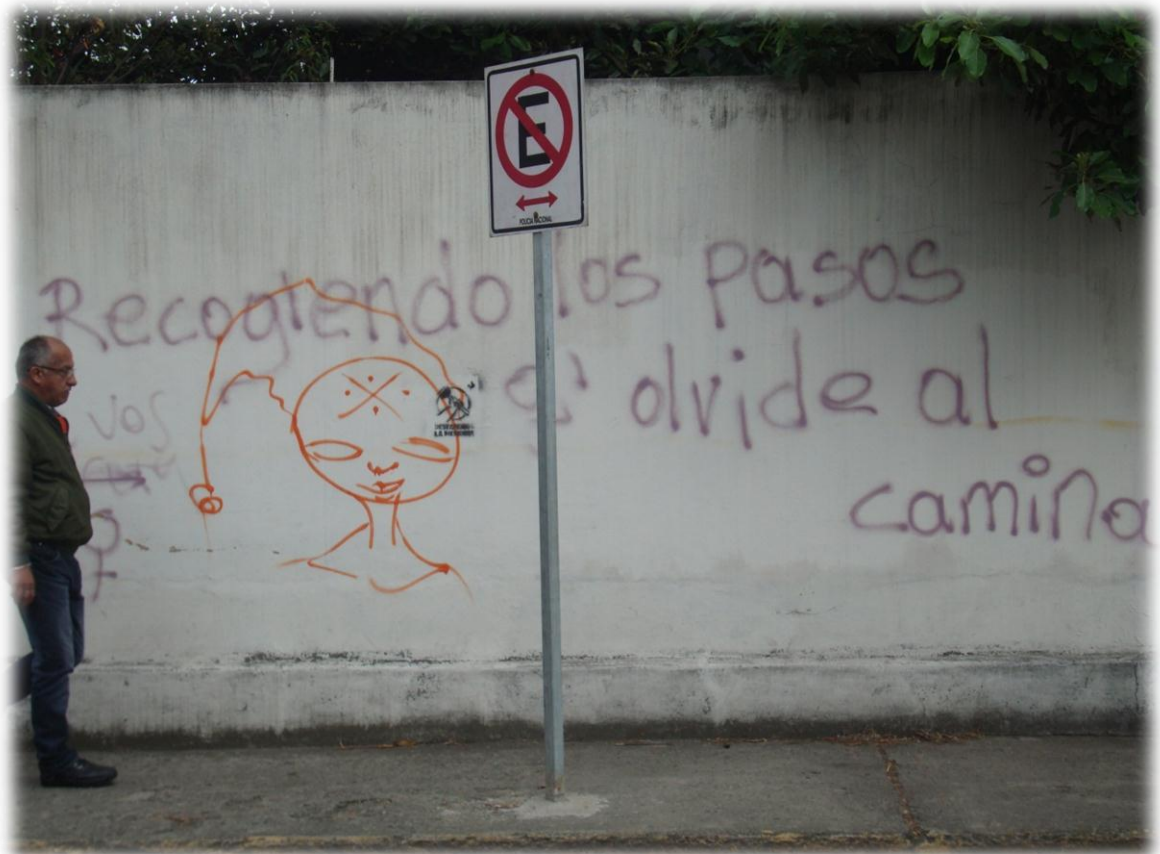
Calle Daniel Córdova. Cuenca-Ecuador (2012)