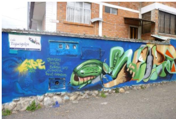
SOPORTE Vía Pública: Calle Tegucigalpa. Cuenca- Ecuador (2014)

Es una marca realizada con cualquier instrumento en lugares públicos como baterías sanitarias, paredes, paradas de buses, señales de tránsito.