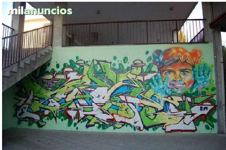
TÉCNICA Aerógrafo: Decoración interior de un establecimiento comercial. Cuenca- Ecuador (2012)

Esta técnica se emplea en el ámbito del grafiti de una forma un poco más comercial, es por naturaleza, una herramienta específica para realizar trabajos artísticos en lugares relativamente pequeños.