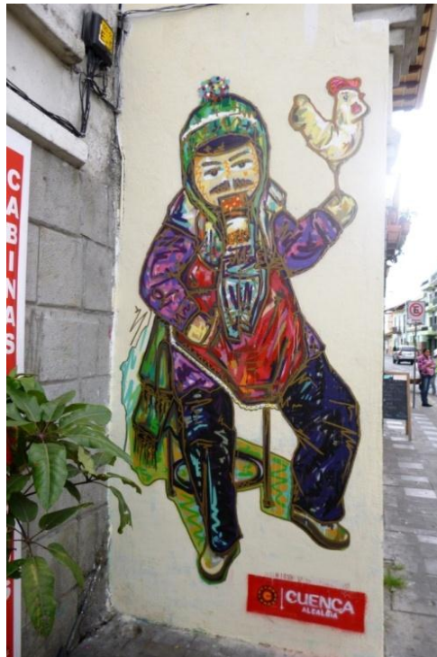
EJECUCIÓN Grafiti Legal: Calle Larga. Cuenca- Ecuador. (2014)