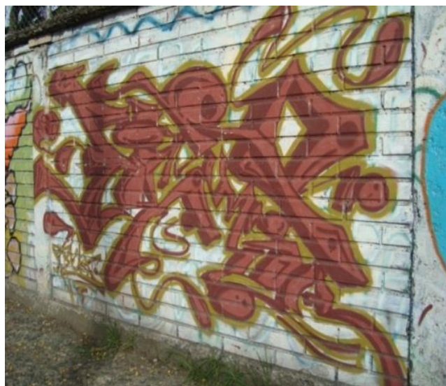
ESTILO Escritura Artística: Paseo Tres de Noviembre. Cuenca- Ecuador. (2012)

A medida que una persona practica esta actividad, con el tiempo se vuelve más hábil y adquiere mayor destreza al momento de idear nuevas formas de letras, y las realiza en menor tiempo. A mediados de los 80 el grafiti (art writing) formó parte de la cultura del hip hop, como uno de los cuatro elementos: DJ (disc jockey), Mc. (maestro de ceremonias o rapper), grafiti, break dance. Aquí es donde se expande su estética artística y se diferencian estilos, como: bubble style, sobrepuesto, wild style, 3D, entre otros.