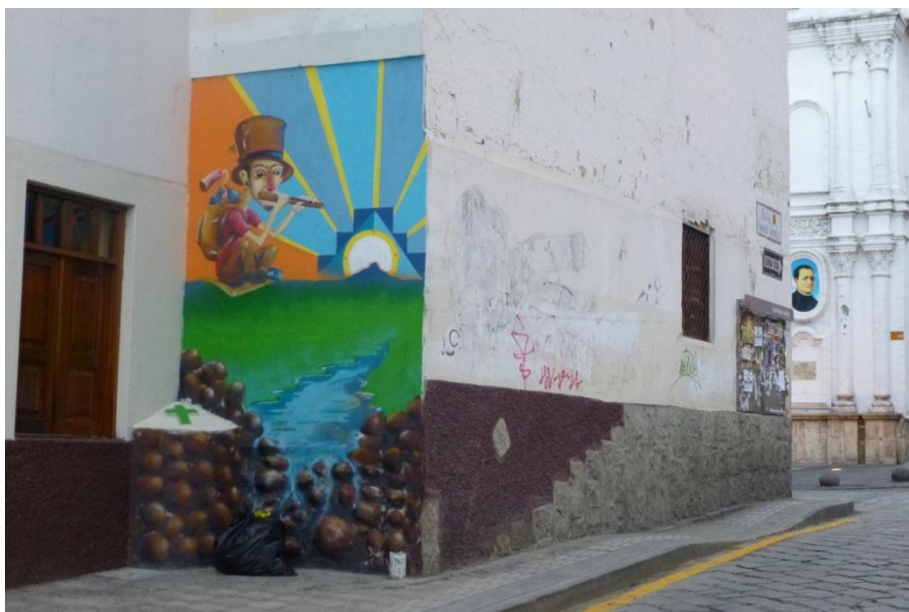
Calle Honorato Vásquez y Borrero Cuenca-Ecuador 2014