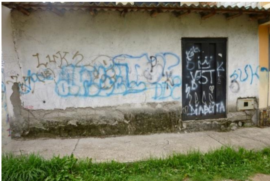
ESTILO Rudimentario: Sector de Gapal. Cuenca- Ecuador (2012)

El grafiti rudimentario encierra en sí un nivel comunicativo único y coloquial, lleno de espontaneidad y rebeldía.