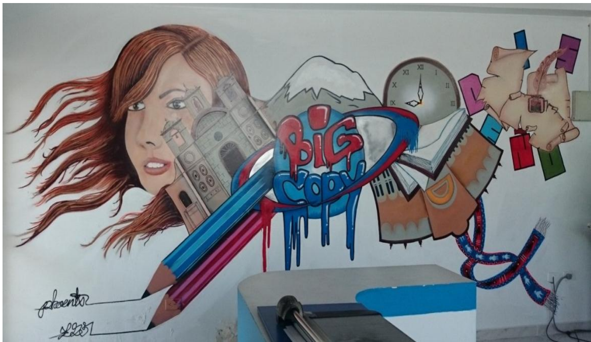
Big Copy Printer.- Centro de Impresiones. (2014)

“Cuando se hace el grafiti legal hay un poco de más calma porque no vamos a estar alerta de que alguien llame a la policía o que salgan las dueños y nos correen... podemos tener más tranquilidad, más serenidad en el muro ahí se logra la calidad con más paciencia, uno se demora a veces dos, tres días en lograr una calidad súper limpia en los trazos, hay ocasiones en las que por pedido y de manera legal se trabajan grafitis publicitarios”.