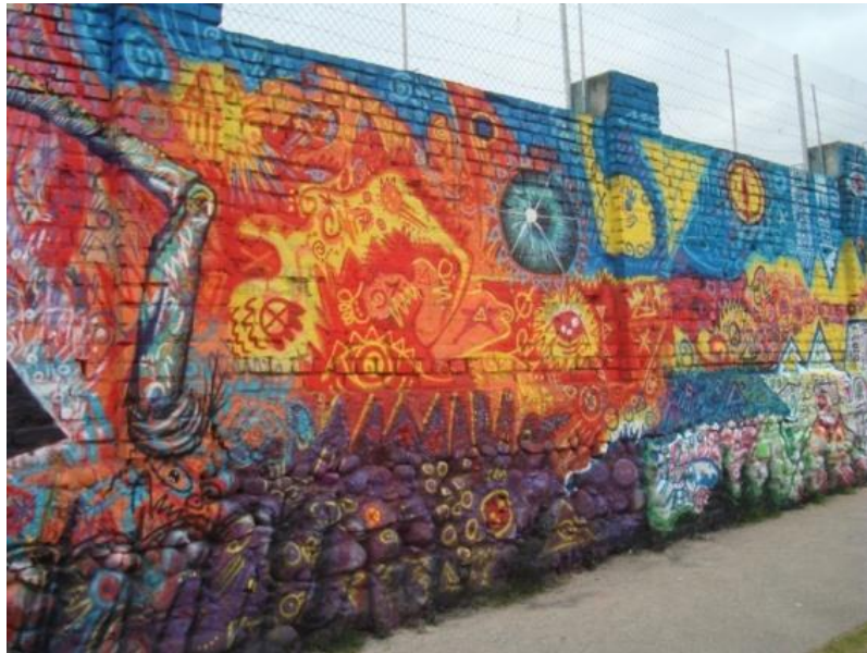
TÉCNICA Pistola de Aire: Muro del Colegio La Salle. Av. Diez de Agosto. Cuenca- Ecuador (2014)

La ventaja de una pistola de aire con relación a un aerosol es que los colores se pueden mezclar a gusto, ampliando las gamas a utilizar, la pintura es un poco más económica y sirve para cubrir grandes superficies.