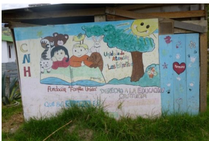
ESTILO Mural: Pintura realizada en los muros de una escuela del área rural. Cuenca- Ecuador. (2011)

Forman parte de este tipo de comunicación y de expresión artísticas, los murales que vemos en las afueras de los establecimientos educativos, que cada vez es más frecuente identificar. Es común que las autoridades organicen a sus alumnos y por cursos, les dispongan un espacio del muro que rodea las instalaciones de cada institución, para que ellos se expresen mediante la pintura.