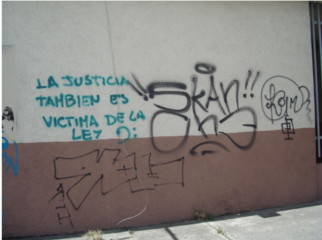
Calle Gran Colombia y Juan Montalvo. Cuenca- Ecuador. (2013)

El grafitero latinoamericano como artista callejero ajusta sus mensajes a la realidad de la que forma parte, porque posee una sensibilidad particular que inciden en su obra, la realidad cotidiana lo golpea con tal fuerza que le impide aislarse de los problemas de la ciudad y país.