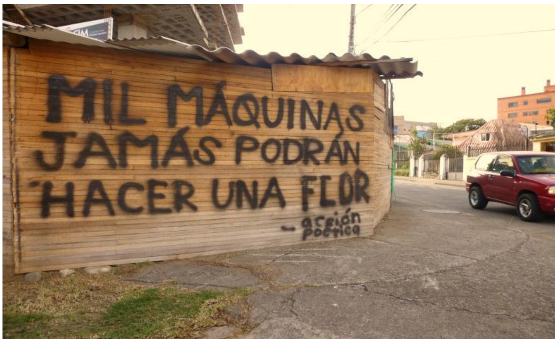
Calle Miguel Moreno. Cuenca – Ecuador. (2013)

el elemento integrador de una posición ideológica común del pueblo que elige esta manera para gritar en la pared como lo señala el epígrafe. Mazzilli, quién cita dos versos de Silvio Rodríguez “Yo he preferido hablar de cosas imposibles, porque de lo posible se sabe demasiado”. Y es justamente esto lo que busca el grafiti. De tal manera que el texto callejero, puede ser tanto una declaración de amor, como una profunda manifestación de reclamo político, de furia social que rompe así con el texto trivial, y se convierte en una denuncia o en una advertencia que algunas veces está cargada de mucho humor.