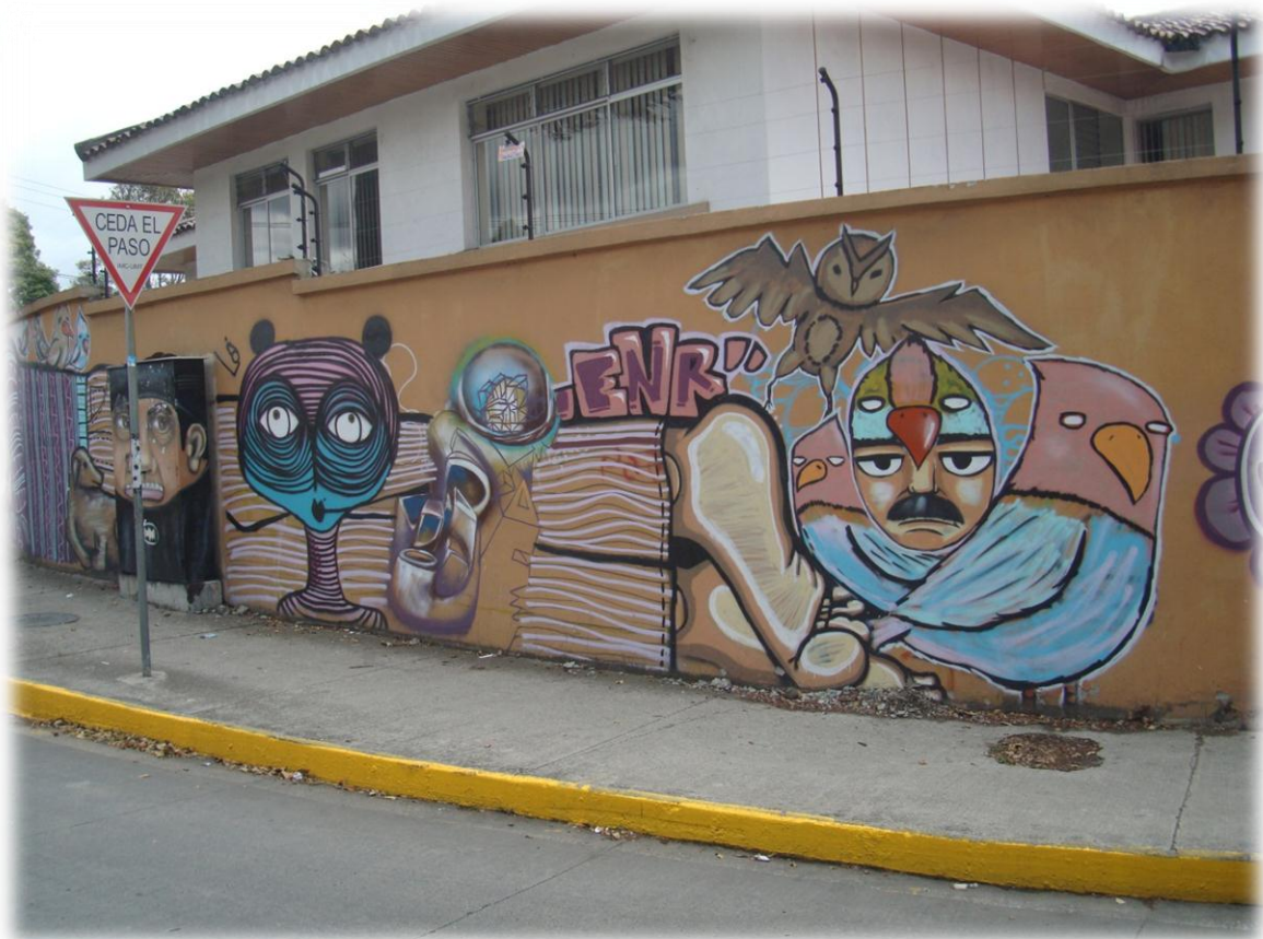
Redondel José Peralta. Cuenca-Ecuador (2013)