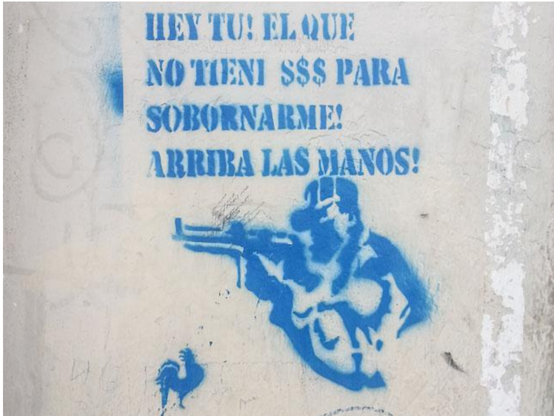
TÉCNICA Stencil: Graffiti en la Av. 12 de Abril Cuenca-Ecuador

Este método es más elaborado, se utiliza para impregnar marcas más gráficas, o ilustraciones más complejas. Consiste en realizar plantillas (o moldes) que luego servirán para formar las figuras, en el instante que realizan contacto con el muro y la pintura en spray.