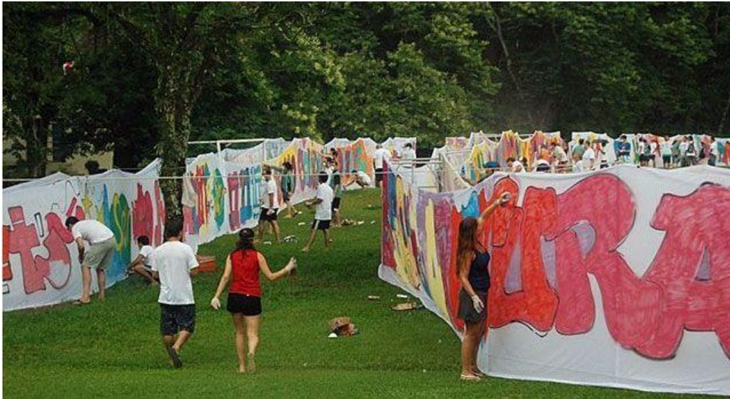
Grafiti realizado en telas (2013)