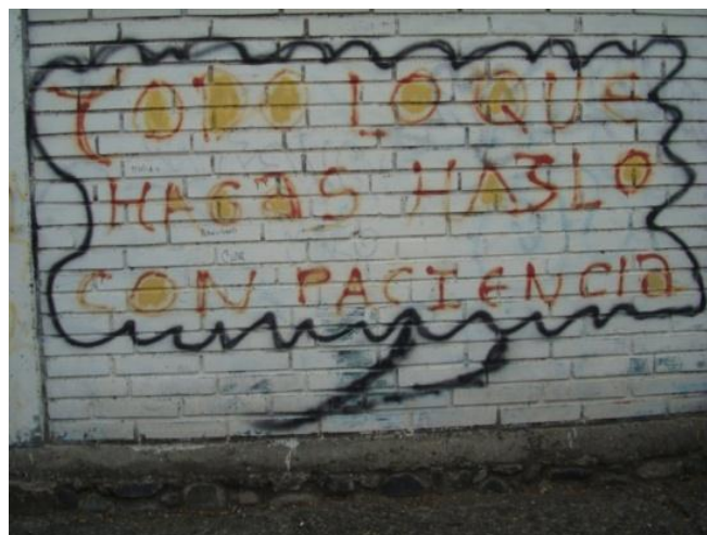
MENSAJE Social: Muros del Colegio Manuel J. Calle. Cuenca- Ecuador (2013)

Los artistas se reúnen y quieren dejar un mensaje en un muro, personas que desean cambiar lo malo del mundo, mensajes que motiven a sus círculos sociales.