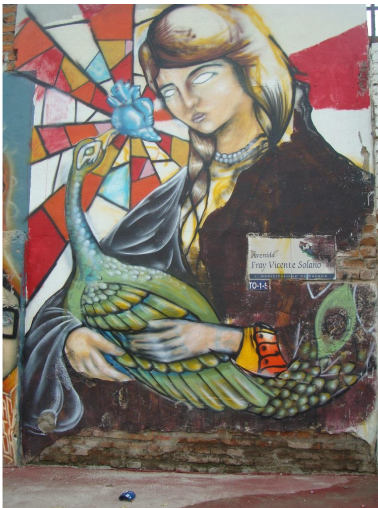
Av. Fray Vicente Solano. Cuenca-Ecuador (2013)

nos metimos debajo de un túnel subterráneo del control sur y allí fue la primera vez que pinté una obra con spray, fue una experiencia súper bacana, llena de adrenalina, ese rato dijimos y ahora, que hacemos, pero que bonito, todos pintábamos. Para mí fue la primera vez que cogía un spray después de un lápiz, comenzamos a pintar, nos demoramos de tres a cuatro horas lo que yo hacía, mientras los otros con experiencia se fijaban en los detalles y seguían elaborando su obra, haciéndolo más perfecta, recuerdo que esa vez nos molestaron los policías pero no paso a mayores. Creo que fue la experiencia más chévere que he pasado, y con tantos artistas que me llenaron de experiencia”. Desde entonces seguí pintando, progresando y perfeccionando. Yo comencé haciendo letras, luego me aburrí porque no tenía una idea clara hasta que me lance a hacer personajes, indiecitos, imágenes, animales y rostros”.