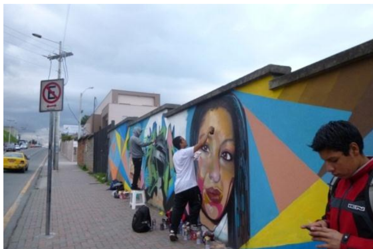
EJECUCIÓN Colectivo: Av. Huayna Capac. Cuenca- Ecuador (2014)

Cuando un grupo de grafiteros se unen para realizar un bombing una pintada o un mural.