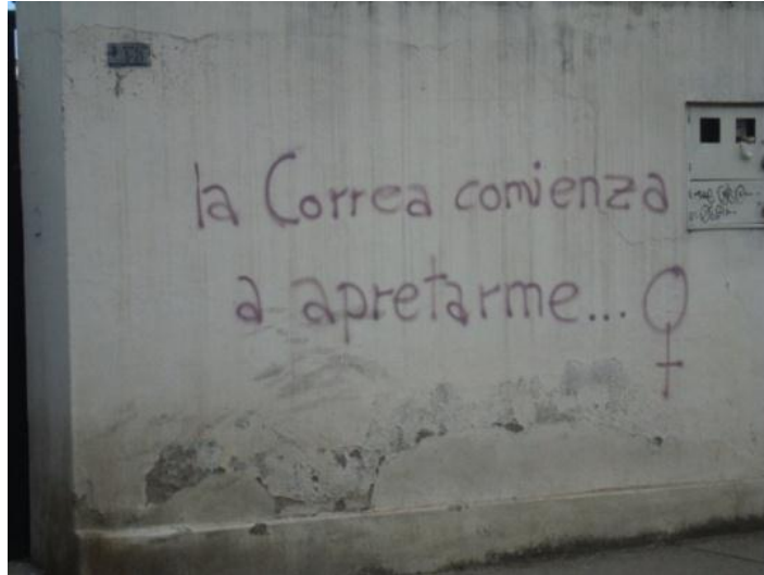
CONTENIDO Texto: Grafiti sector de la Universidad de Cuenca. Cuenca- Ecuador (2013)

En este grafiti se encuentran frases que invitan a la reflexión.