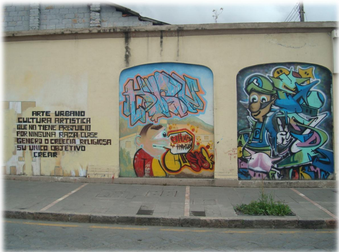
Calle Bolívar y Huayna Capac. Cuenca-Ecuador (2012)