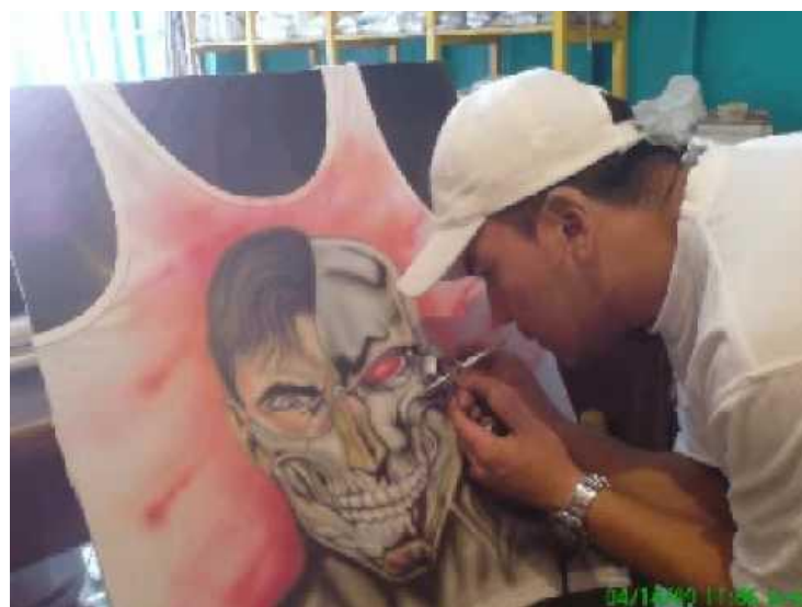
TÉCNICA Aerógrafo. Cuenca- Ecuador (2013)

Como posee una válvula que regula la dimensión del halo de pintura, los trazos se tornan sutiles y más manejables, mejorando la calidad de trabajo en dichas superficies como camisetas, gorras, zapatos, pequeños detalles en un mural, para decorar vehículos con más precisión, etc.