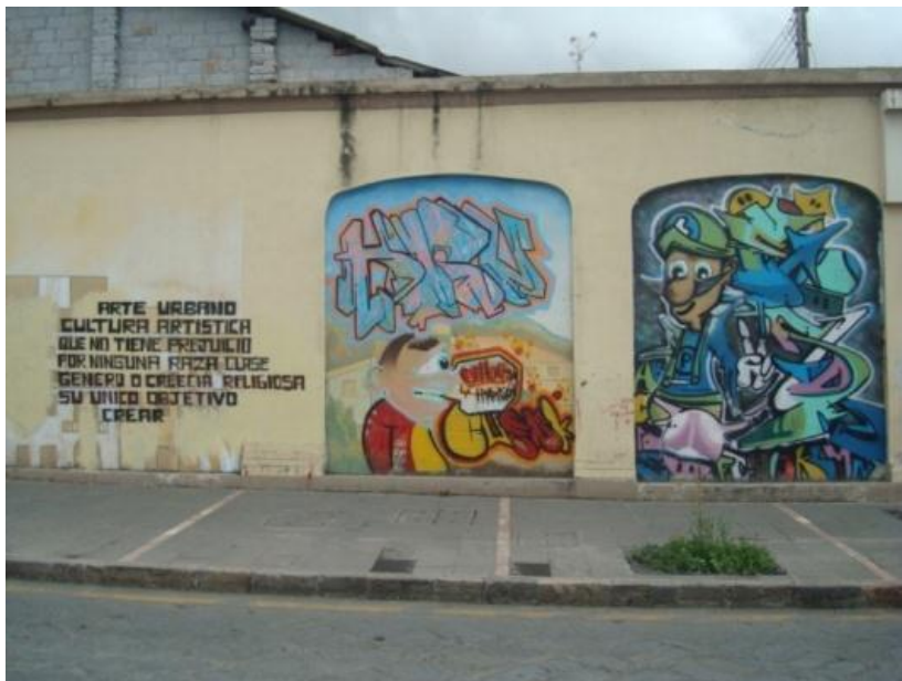
TÉCNICA Aerosol: Grafiti Av. Huayna Cápac y Bolívar. Cuenca- Ecuador (2013)

Se utiliza tanto para el grafiti panfletario como para el bombing y el art writin, también es primordial para realizar sténcil.