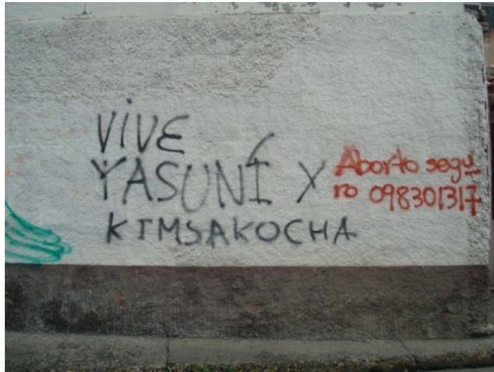
ESTILO Bombing: Muros del Colegio Manuel J. Calle. Cuenca- Ecuador. (2011)

Es el acto de ir a un lugar sin permiso y pintar entre varias personas en el menor tiempo posible.