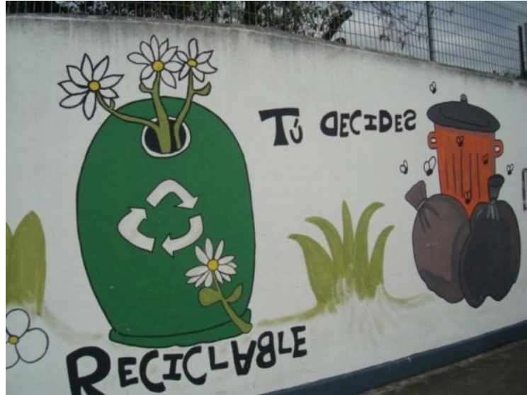
CONTENIDO Combinado: Calle Remigio Romero. Cuenca- Ecuador (2011)

En este caso vemos muros con palabras pintadas, y al lado dibujos.