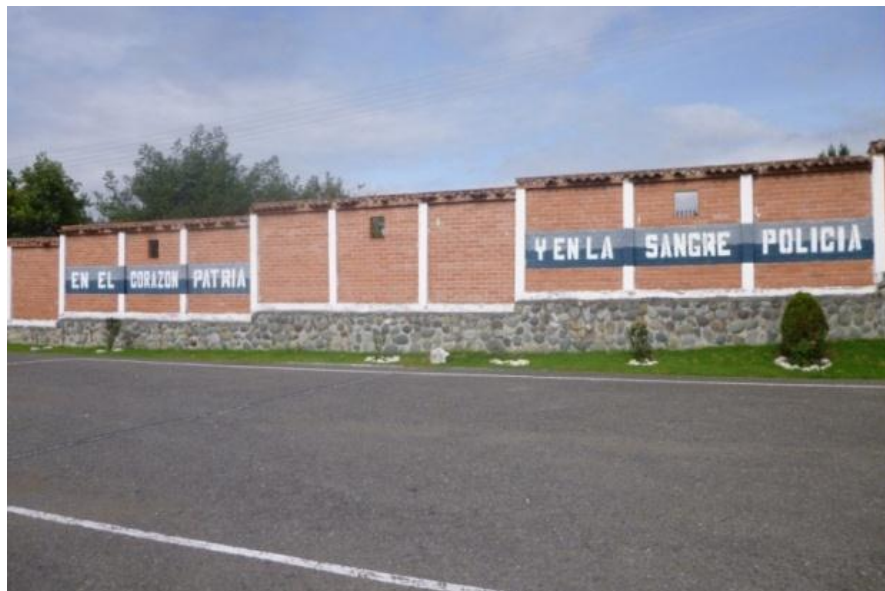
CONTENIDO Texto: Muro del Comando de Policía. Cuenca- Ecuador (2011)

A veces también son palabras pintadas a con varios colores.