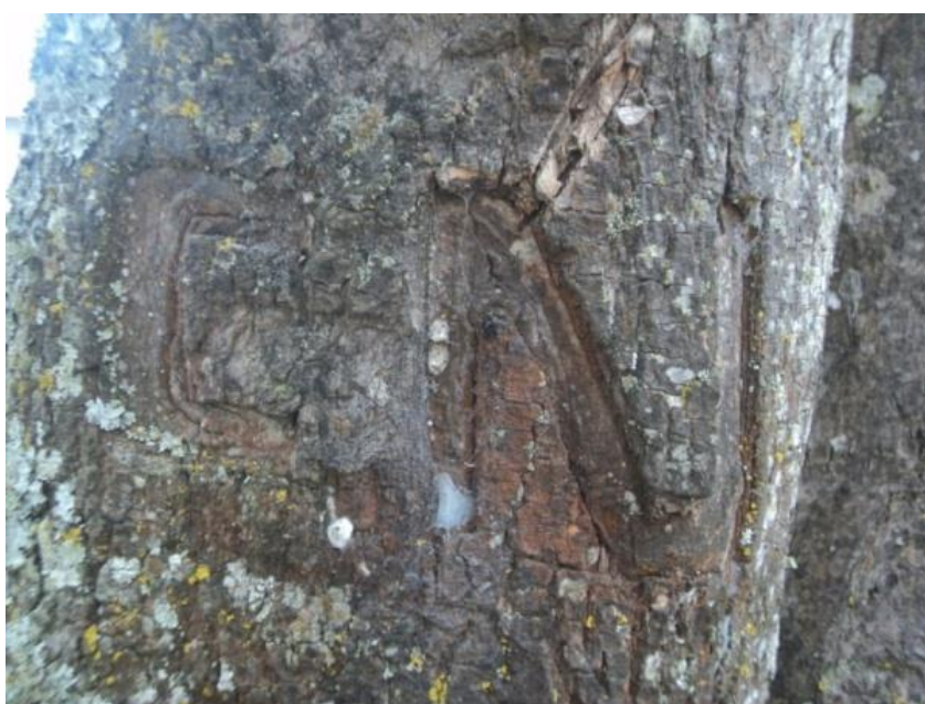
TÉCNICA Scratchin: Marca realizada en la corteza de un árbol del parque “El Paraíso”. Cuenca- Ecuador. (2012)

En el dialecto de la cultura del “art writin”, el scratch no es más que emplear una piedra, una navaja, o cualquier objeto que tenga filo, para rasgar una superficie y de esta manera dejar una marca, ya sea una consigna, un tag o un dibujo, cualquier tipo de expresión.