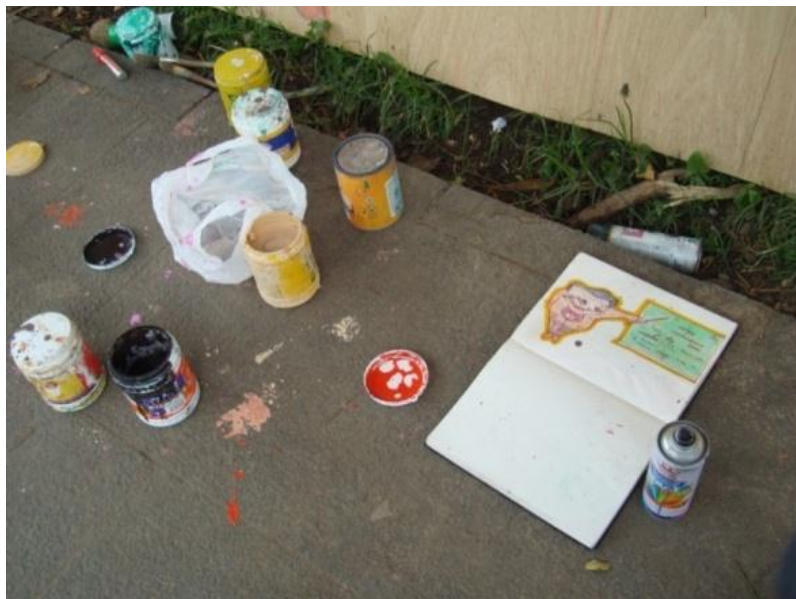
TÉCNICA: Brocha y Pincel, utilizadas para grafitear en el cerramiento de madera del Parque de la Madre cuando se encontraba en remodelación 2013

Son las herramientas antiguas que se han inventado para aplicar pigmentos de una forma regular, se emplean embarrándolas de tinta, y aplicando directamente en la superficie.