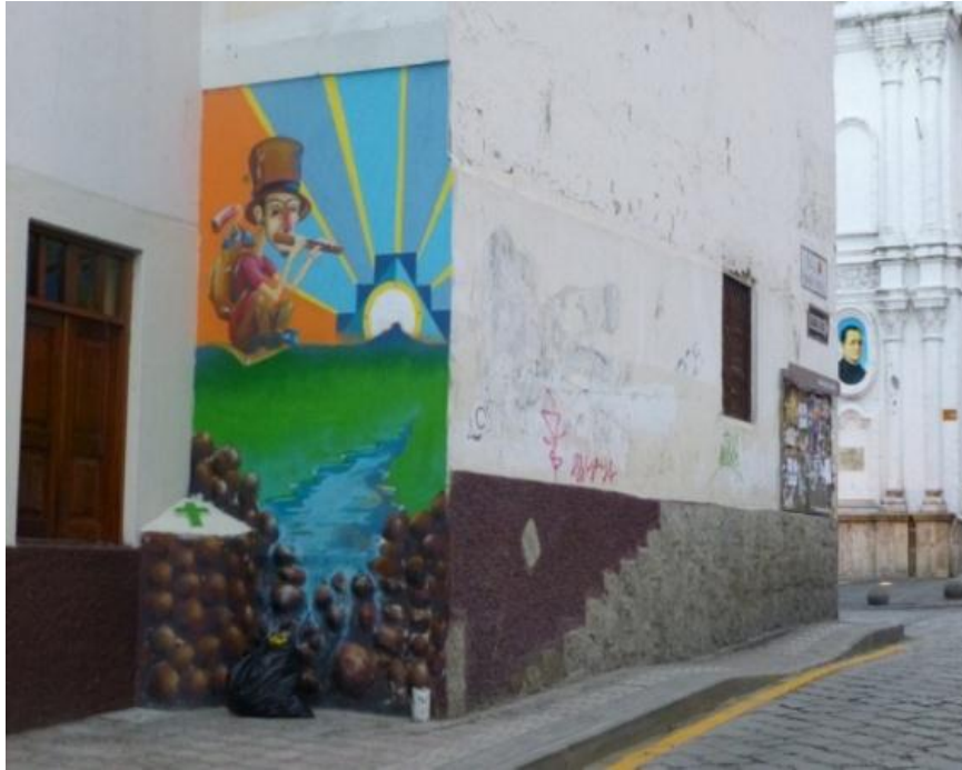
EJECUCIÓN Grafiti Legal: Calle Honorato Vásquez. Cuenca- Ecuador. (2014)