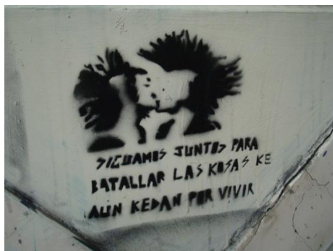
CONTENIDO Romántico: Calle Hermano Miguel. Cuenca- Ecuador (2013)

Es típico de los adolescentes jóvenes cuando desean expresar sus emociones, lo hacen en cualquier lado: bancas del colegio, paredes, parada de buses, parques bibliotecas, el instrumento utilizado puede ser cualquiera.