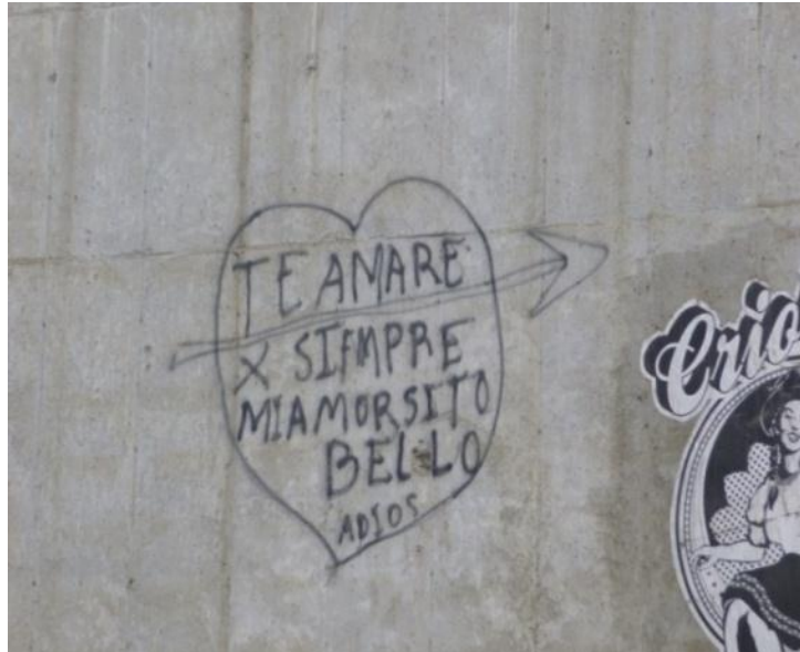
ESTILO Rudimentario: Sector Centro de la ciudad. Cuenca- Ecuador (2012)