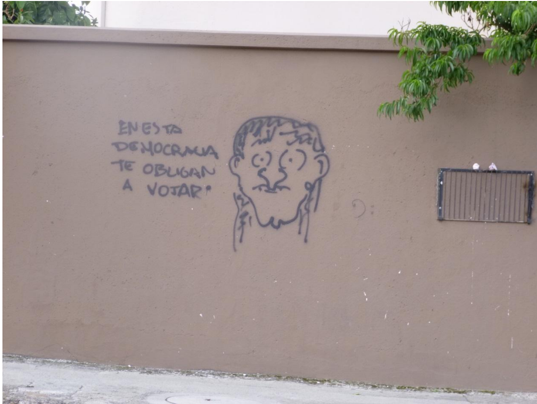
CONTENIDO Político: Av. Remigio Crespo. Cuenca- Ecuador (2013)