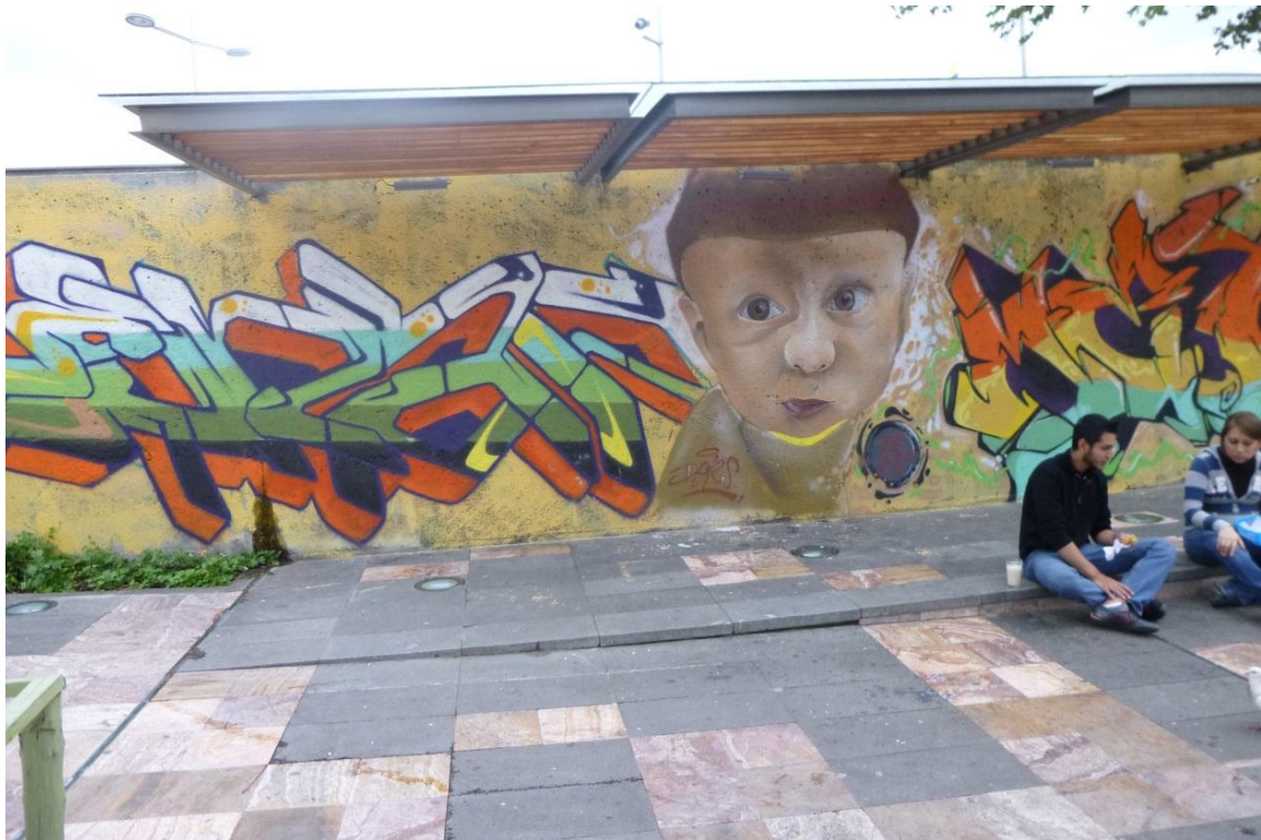
Sector Medio Ejido. Cuenca-Ecuador 2013

A través de medios no convencionales, el grafiti plasma su mensaje en grandes lienzos, las paredes de la ciudad, con letras, dibujos, etc., hace que la gente hable sobre ellos, aunque muchas veces no lo entienda o se molesten por su presencia. “Por aquí anduvo Don Quijote”, “No llores por un mundo que lucha, lucha por un mundo que llora”, “El agua no se vende, el agua se defiende”, son algunos de los grafitis cuencanos.