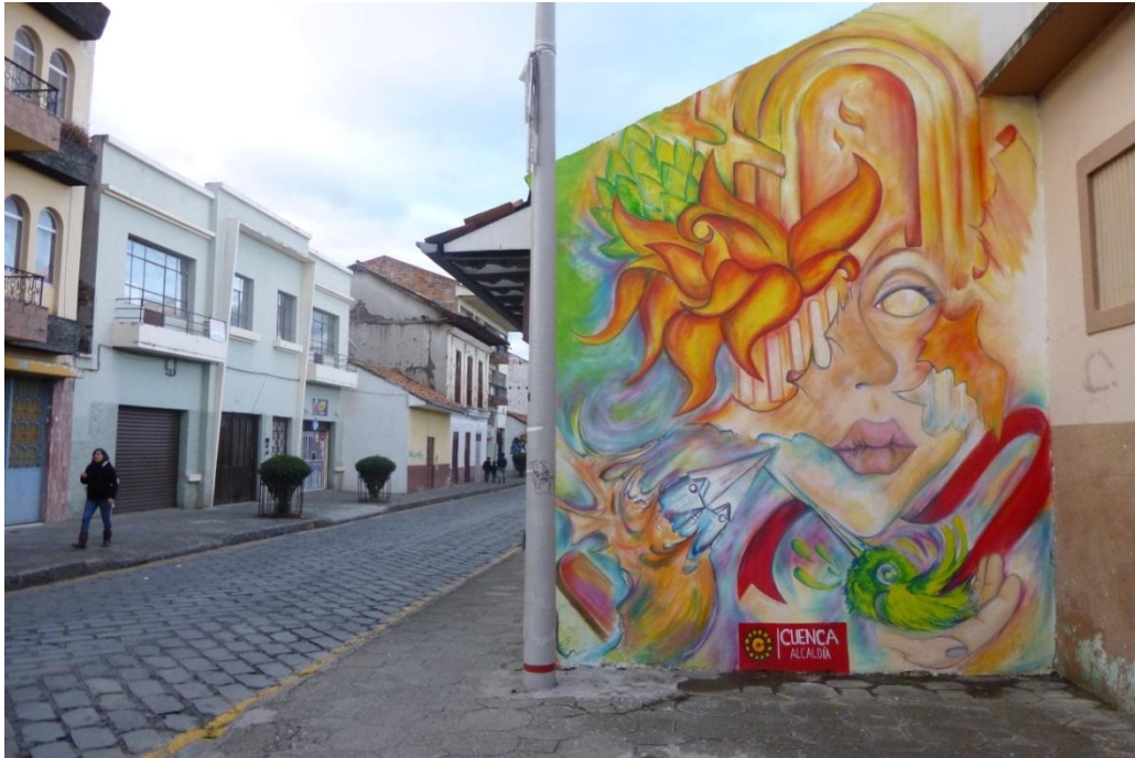
EJECUCIÓN Grafiti Legal: Calle Mariano Cueva. Cuenca- Ecuador PROYECTO “ESPACIOS RESIDUALES” DE LA MUNICIPALIDAD DE CUENCA