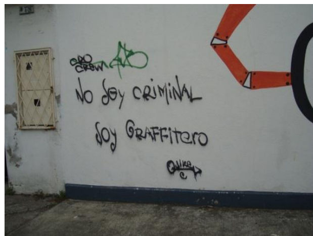
CONTENIDO Político: Calle Remigio Romero. Cuenca- Ecuador (2012)

Vemos casas decoradas con propaganda hecha a brocha, muros con los nombres de los movimientos sociales, pintadas rebeldes en contra al presidente hechas a aerosol, cualquier técnica puede incluirse en este tipo de grafiti.