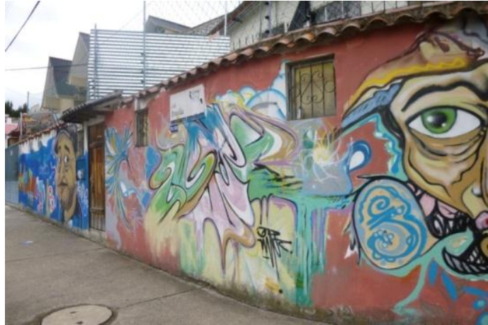
ESTILO 3D Bombardeo: Calle Tegucigalpa Ciudadela Tomebamba. Cuenca- Ecuador. (2013)

Cuando es ilegal, se le denomina “bombing” o bombardeo.