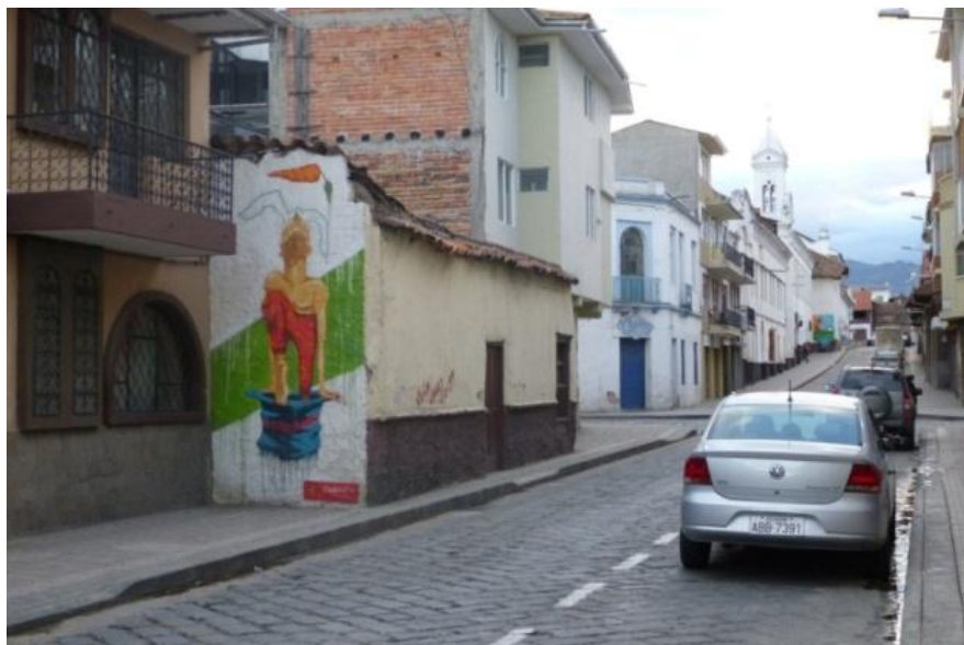
EJECUCIÓN Grafiti Legal: Calle Honorato Vásquez. Cuenca- Ecuador PROYECTO "ESPACIOS RESIDUALES" DE LA MUNICIPALIDAD DE CUENCA