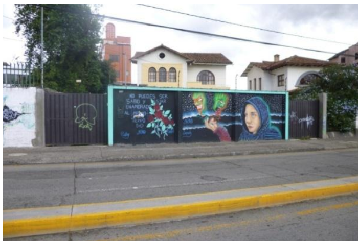
Estilo Mural: Redondel del Estadio. Cuenca- Ecuador. (2014)

Las creaciones se realizan con técnicas mixtas, en los parques, muros de instituciones educativas, barrios populares, son lugares en donde ya es común ver varias y coloridas formas, letras, ilustraciones, ya sea con algún tema específico o simplemente expresión artística.