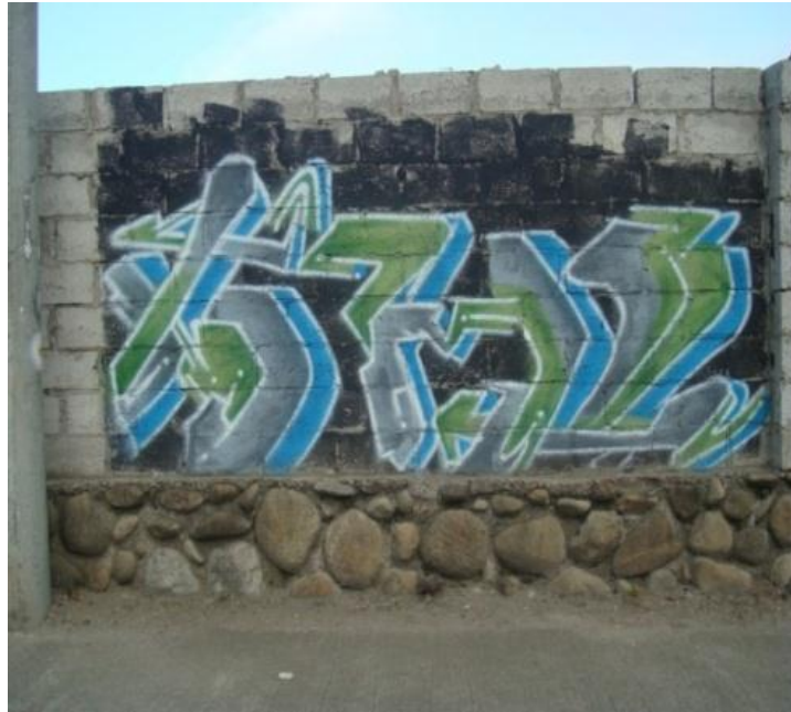
ESTILO Escritura Artística (Art writing): Muros del Colegio César Dávila Andrade. Cuenca- Ecuador. (2012)

A medida que una persona practica esta actividad, con el tiempo se vuelve más hábil y adquiere mayor destreza al momento de idear nuevas formas de letras, y las realiza en menor tiempo. A mediados de los 80 el grafiti (art writing) formó parte de la cultura del hip hop, como uno de los cuatro elementos: DJ (disc jockey), Mc. (maestro de ceremonias o rapper), grafiti, break dance. Aquí es donde se expande su estética artística y se diferencian estilos, como: bubble style, sobrepuesto, wild style, 3D, entre otros.