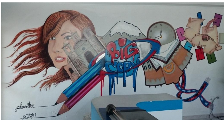
Big Copy Printer.- Centro de Impresiones. (2014)

El grafiti comenzó como protesta, en los Estados Unidos, entonces ahí se dio un vandalismo, creo que en Cuenca también, pero el grafiti ha ido evolucionando, ahora ha incursionado hasta a lo comercial.