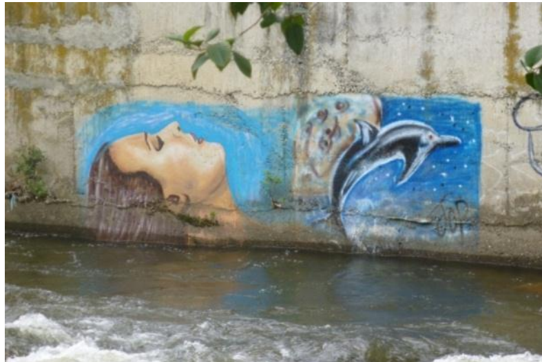
TÉCNICA Aerosol: Paseo Tres de Noviembre, Orillas del Río Tomebamba.

Como ustedes se pueden dar cuenta, esta es una de las herramientas más populares de la actividad de realizar grafiti, es muy funcional por el hecho de que es portátil, no importa en qué superficie se emplee, el aerosol, las cubre sin problemas.