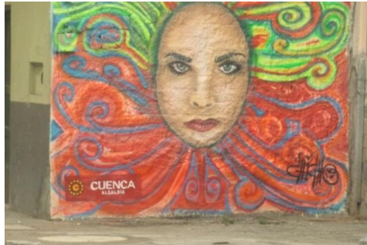
EJECUCIÓN Grafiti Legal: Calle Mariano Cueva. Cuenca- Ecuador. (2014) PROYECTO DE LA MUNICIPALIDAD DE CUENCA

Cuando existe una disposición de poder ocupar un espacio ajeno o el visto bueno de la Ilustre Municipalidad de Cuenca.