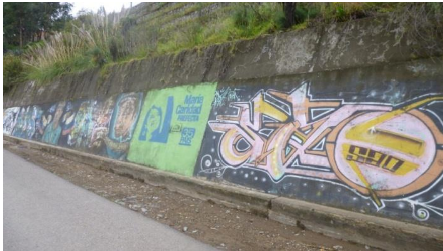
ESTILO Mural: Muro de Hormigón de Quinta Chica. Cuenca- Ecuador. (2014)

El mural también se distingue en la propaganda política sobre todo cuando se realizan campañas electorales, las paredes de todo Ecuador se inundan de los colores de los partidos políticos, las ilustraciones de los candidatos, consignas políticas, etc.