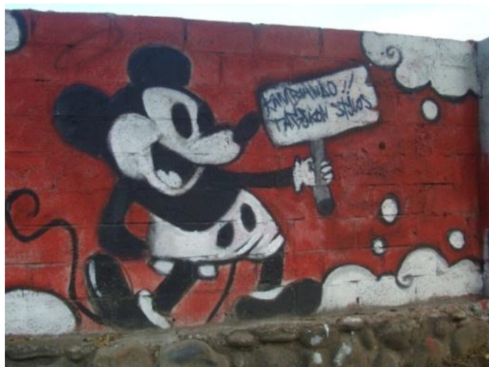
Contenido Ilustración: Av. González Suarez. Cuenca- Ecuador. (2013)

Pueden ser de cualquier índole: personajes de las caricaturas, súper héroes, figuras antropomorfas, rostros de candidatos políticos, etc. y puede intervenir stencil, pinceles, aerosoles con boquillas y más.